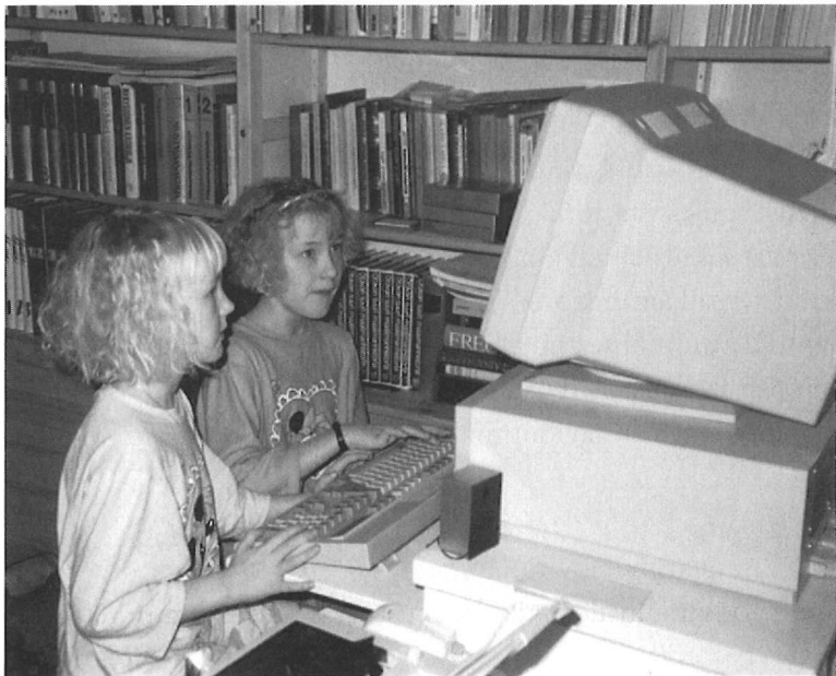
Tietokonepelien lumoissa. 1992.