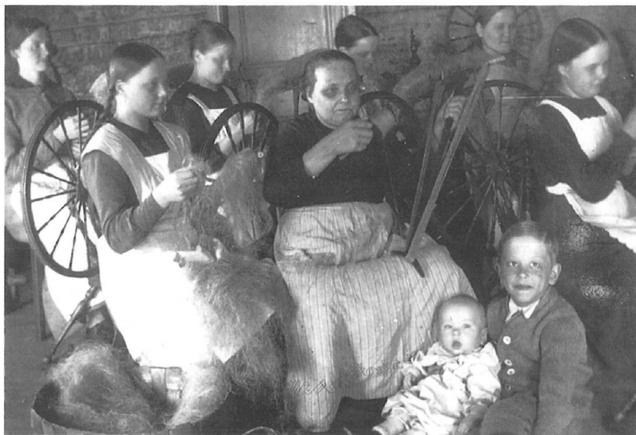
Lapset naisten kebruuta seuraamassa 1930-luvulla.