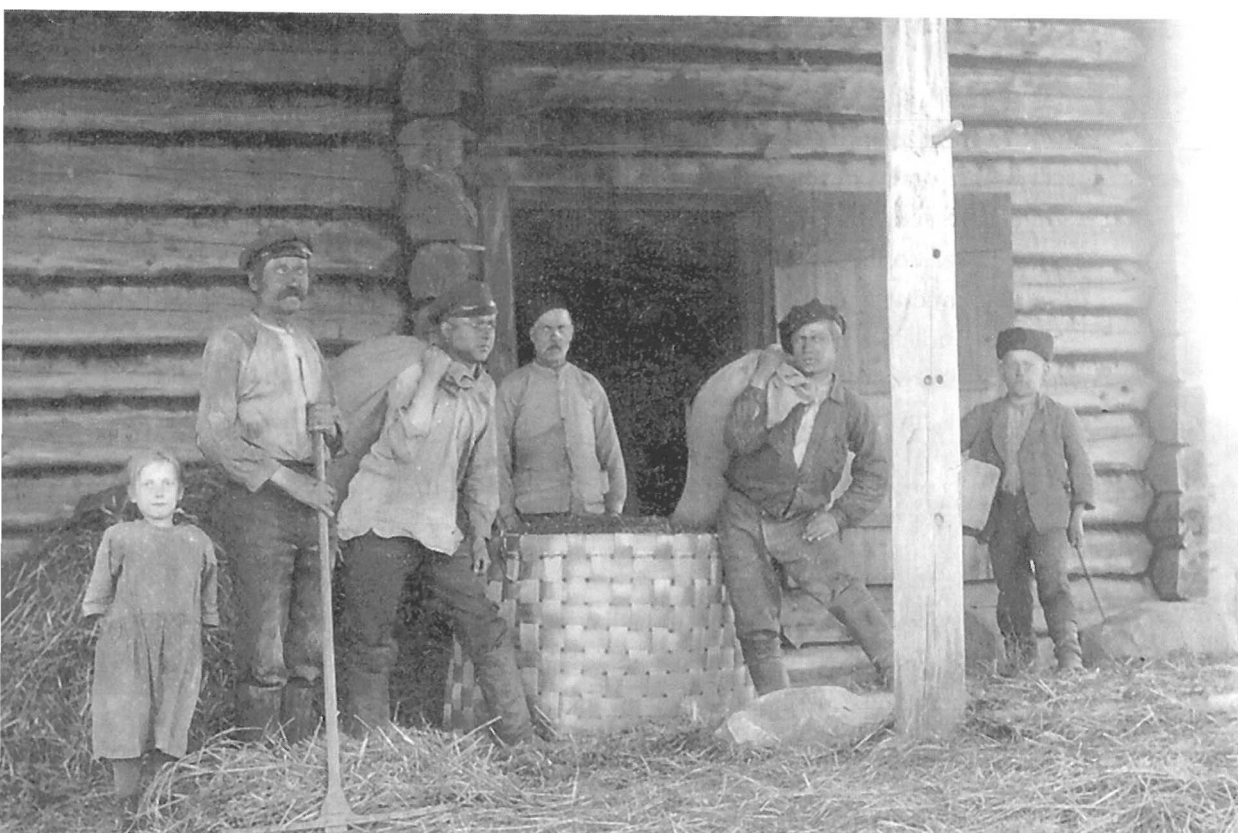
Riihenpuinnin tauolla 1924 Toivakassa.