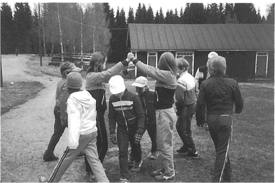
“Truu truu trallaa, kello löi jo kaksitoista, keisari seisoo palatsissa--” – Kuv. Pirjo Korkiakangas 1987.