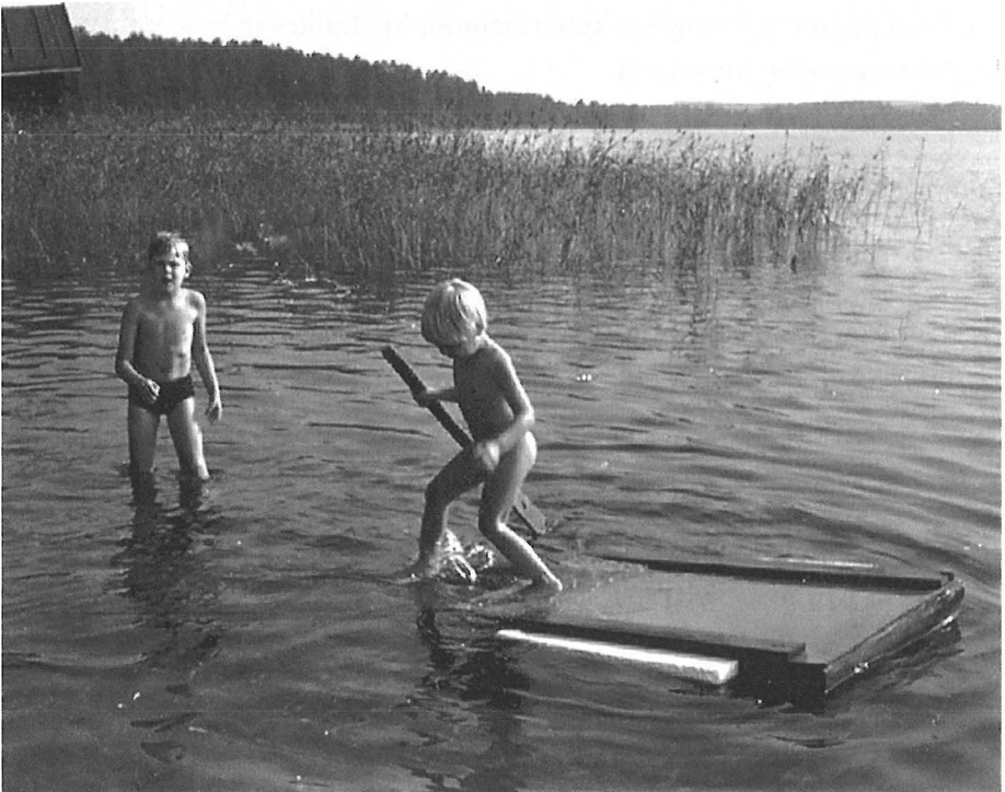
Lautalla seikkailuihin. – Kuv. Pirjo Korkiakangas 1980.