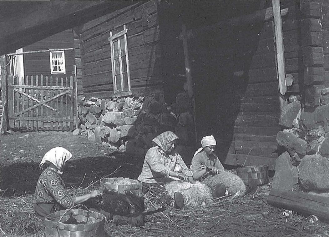
Viitasaarelaisen talon emäntä tyttäriineen lampaista keritsemässä. Kuv. T. Vahter 1926. – Museovirasto.