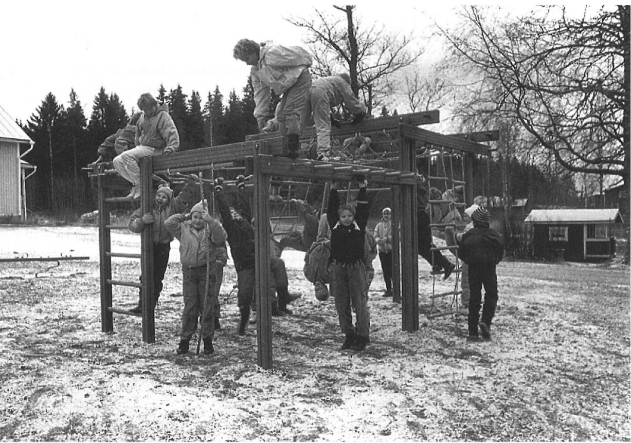
“Verkoilla” leikkijät. – Sisä-Suomen Lehden kuva-arkisto.

ainakin jonkinlaisia mahdollisuuksia tulkita neljän, jopa viiden eri sukupolven käsityksiä siitä, mitä leikiksi mielletään. Koululaisten vanhempien kyselyvastauksissa tematisoituivat seuraavat ryhmät: