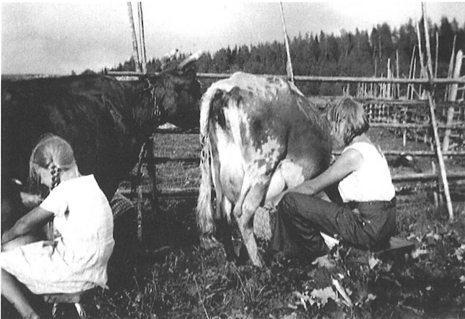
Unelmaa ja Rusinaa lypsetään. Kuva on 1930-luvun puolivälistä. – Saarijärven museon kuva-arkisto.