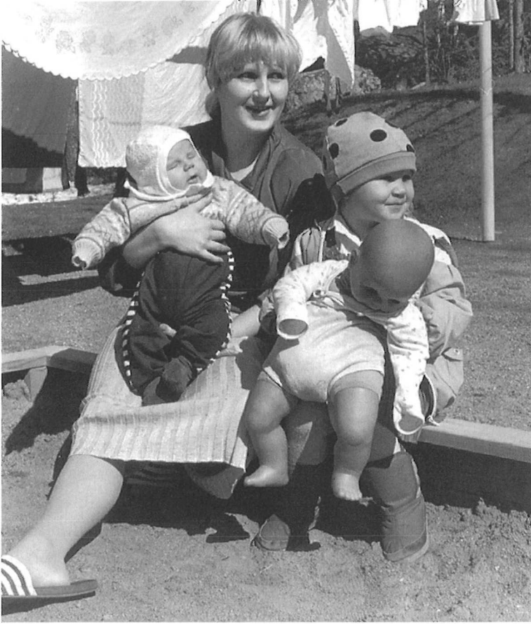
“Äidit” vauvoineen.

nimeten – vanhimpienkaan muisteluissa – piikoja, renkejä tai juuri muitakaan ydinperheen ulkopuolisia.