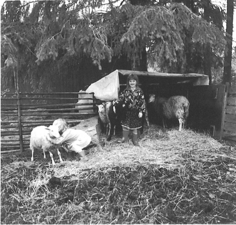
Tytöt nimikkolampaitaan hoivaamassa. – Kuv. Ulla Lipsanen 1995.