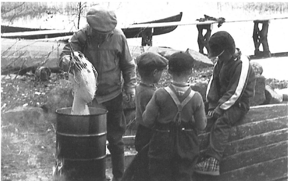
Pappa ja pojat verkkoja värjäämässä 1960.

Lapset otettiin mukaan työmaalle, esim. pellolle tai riiheen niin pieninä kuin ne pystyivät tulemaan toimeen, noin 3-4 vuotiaina. Vähän isompana piti jo olla työssä mukana vointinsa mukaan. Kevyimpiä,