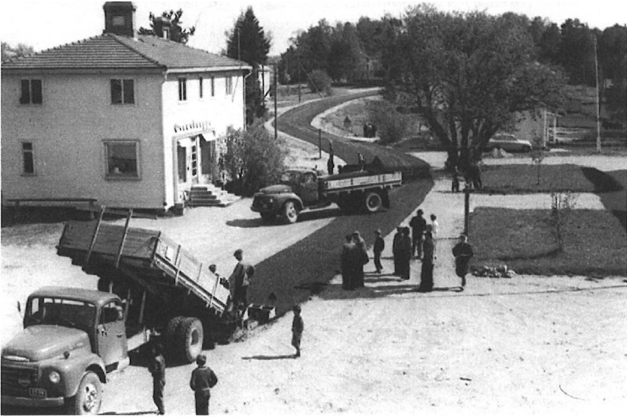
"Pikitiien" tulo Sumiaisten kirkonkylään 1962.

Kuluvan vuosisadan alkupuolella yli 85 % nykyisen Keski-Suomen läänin alueen väestöstä hankki elantonsa maa- ja metsätaloudesta; vielä 1930-luvun lopussa lähes 70 %, 1950-luvulla noin puolet ja 1970-luvulla reilu neljännes keskisuomalaisista oli maa- ja metsätalouden harjoittajia, mutta 1980-luvun puolivälissä maataloudesta sai toimeentulonsa enää noin 15 %. Tämän vuosisadan ajan maatalouden osuus ammatissa toimivasta väestöstä on Keski-Suomessa ollut noin 10% koko maan keskiarvoa suurempi. Toisaalta Keski-Suomen maatalous on koko vuosisadan ajan pysynyt pientilavaltaisena. Luonnollisesti Keski-Suomen sisällä on ollut selviä alueellisia eroja: aineistojeni keruun kohdekunnista Sumiainen on säilynyt pitkään yhtenä maatalousvaltaisimmista, esimerkiksi 1985 vielä yli puolet kunnan asukkaista eli maataloudesta; vastaavasti Äänekosken asukkaista noin puolet sai elantonsa maataloudesta 1930-luvulla, 1970-luvun alussa vain 13 % ja 1987 enää kuusi prosenttia. (Jokinen 1993, 100-103; Lehtonen 1992, 3-4.) Pientilavaltaisuus on ollut luonteenomaista erityisesti pohjoiselle Keski-Suomelle, suurempia tiloja, säätyläisiä ja vauraampaa virkamieskuntaa on ollut suhteellisesti enemmän vanhoissa hämäläispitäjissä Keski-Suomen eteläosissa. (Laitinen 1988, 111-114; Jokinen 1993, 107-117.)