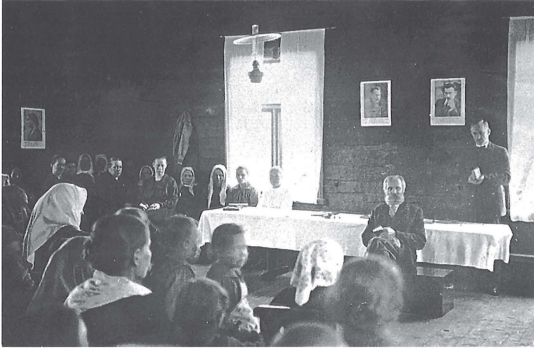
Tupakinkerit Konnevedellä 1900-luvun alussa.