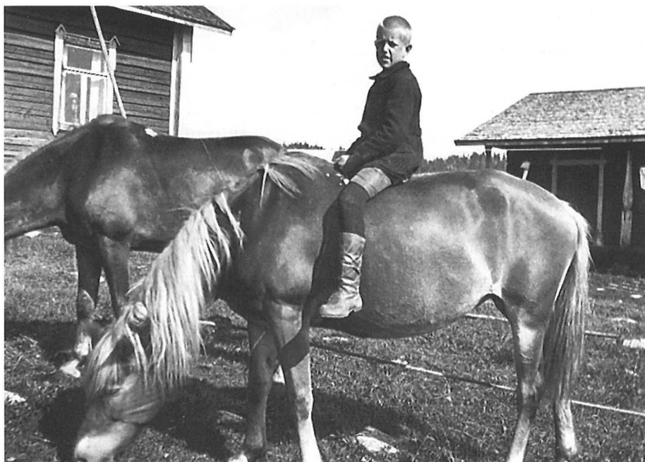
Liinulla ratsastaja 1920-luvulta. – Keski-Suomen museon kuva-arkisto.

Muistanpa ajan, kun ensikerran tartuin sahran kurkeen, kun isä oli kyntämässä sahroilla, silloin ei ollut auroja, niin hän jätti hevosen ja sahrat pystyyn pellolle. Kävin sahran tappeihin kiinni ja käskin hevosta joka totteli. Siinä mentiin ehkä 20 m niin sahrat kaatui ja minä kiireenvilkkaa navetan taakse seuraamaan mitä isä sanoo. Hän arvasi asian myhäillen itsekseen. (MV:KA21/252, mies s. 1901.)