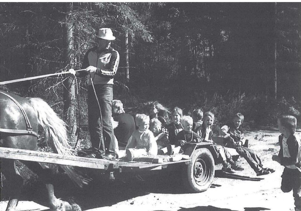
Sumiaisten lapsia hevoskyytiä saamassa.