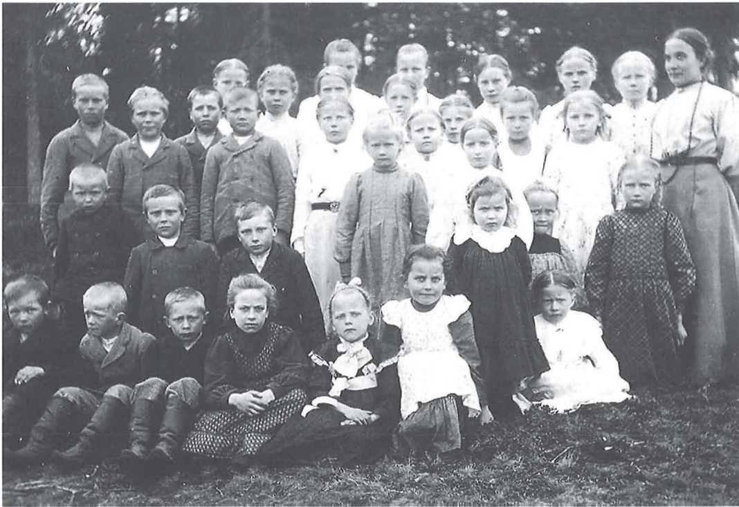
Kivijärven kiertokoululaisia 1910-luvulla.

Seuraavan aukeaman kuva: Karstulan koululaisia asioimassa kirjastoautossa 1977.