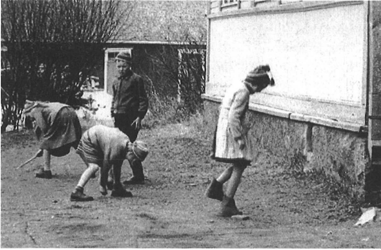
Ruutuhyppelyä ja maan valloitusta 1950-luvun puolivälissä.