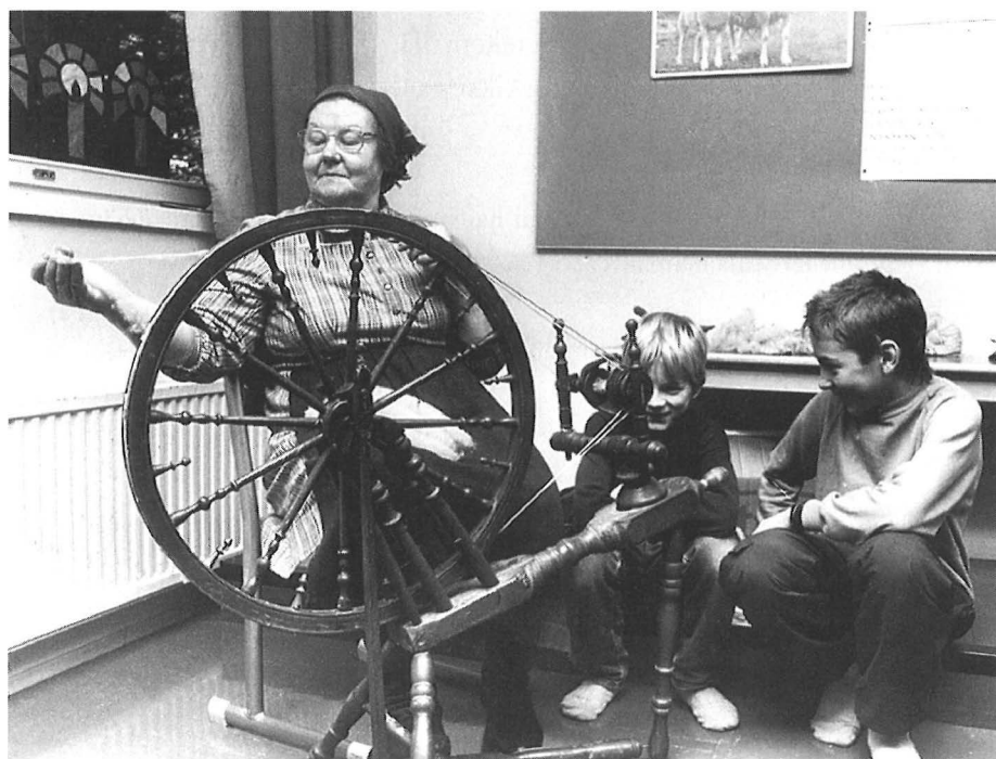
Koulupojat käsityöperinteen “opissa” 1980-luvulla.