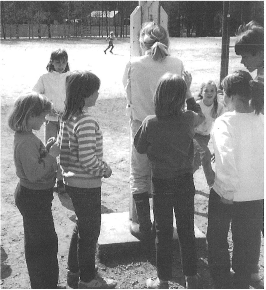
“Vasta pesty puhas selkä, kuka siihen viimeks koski likasilla käsillään.” Kirkonrottaa leikitään koulun välitunnilla. – Kuv. Pirjo Korkiakangas 1987.