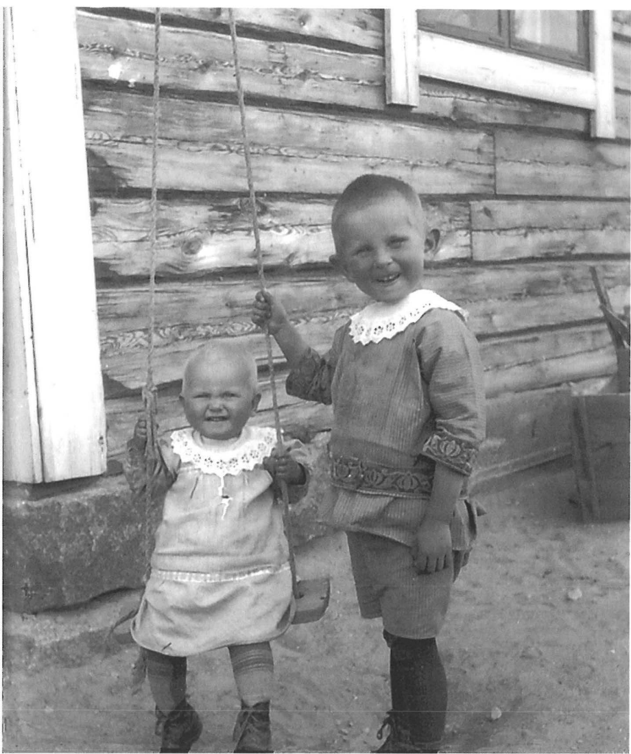
Keinuja ja keinuttaja 1910-luvun alusta.

Pienempien kahtomista kun aikuiset etäämpänä, kävivät Kalajärven rannalla asti heinää niittämässä. Päivät piti olla pienempien kanssa kotona. Kyllähän joskus kävi näin että kun aika kävi pitkäksi ja pienemmät itki, itkettiin isommatkin kun vanhemmat tuli kotiin. Äiti laittoi aina valmiiksi ruuan, pienemmät oli syötettävä. Tietysti joutui kuivaa-kin muuttamaan ja pestävä pyllä. Siinähan oli sitä rätтинukkeja ja oli puuhevosia. Niillä koitettiin sitten viihdyttää. Katossa vakka narulla kiinni, siihen nukkumaan ja kiikutettiin. Laulettiin aa, aa, Allin lasta, tule uni uunin päältä. Tuntu että kun lapsi rupes kuuntelemaan, nukahti kun laulunhyrinätä piettiin. (H86N1922, 2-3.)