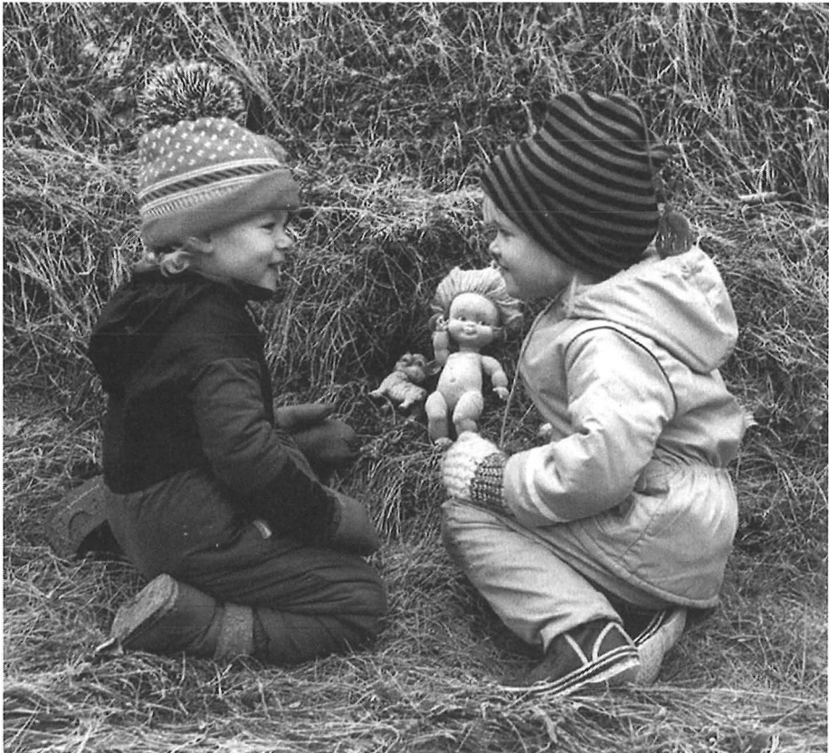
Nukkeleikkejä pihamaalla.

Naapurin pojat varsinkin leikki kovasti niitä intiaanileikkejä. – Ja tota ni ne kesällä aina innokkaasti leikki niitä leikkejä ja sitt siellä yks vel-