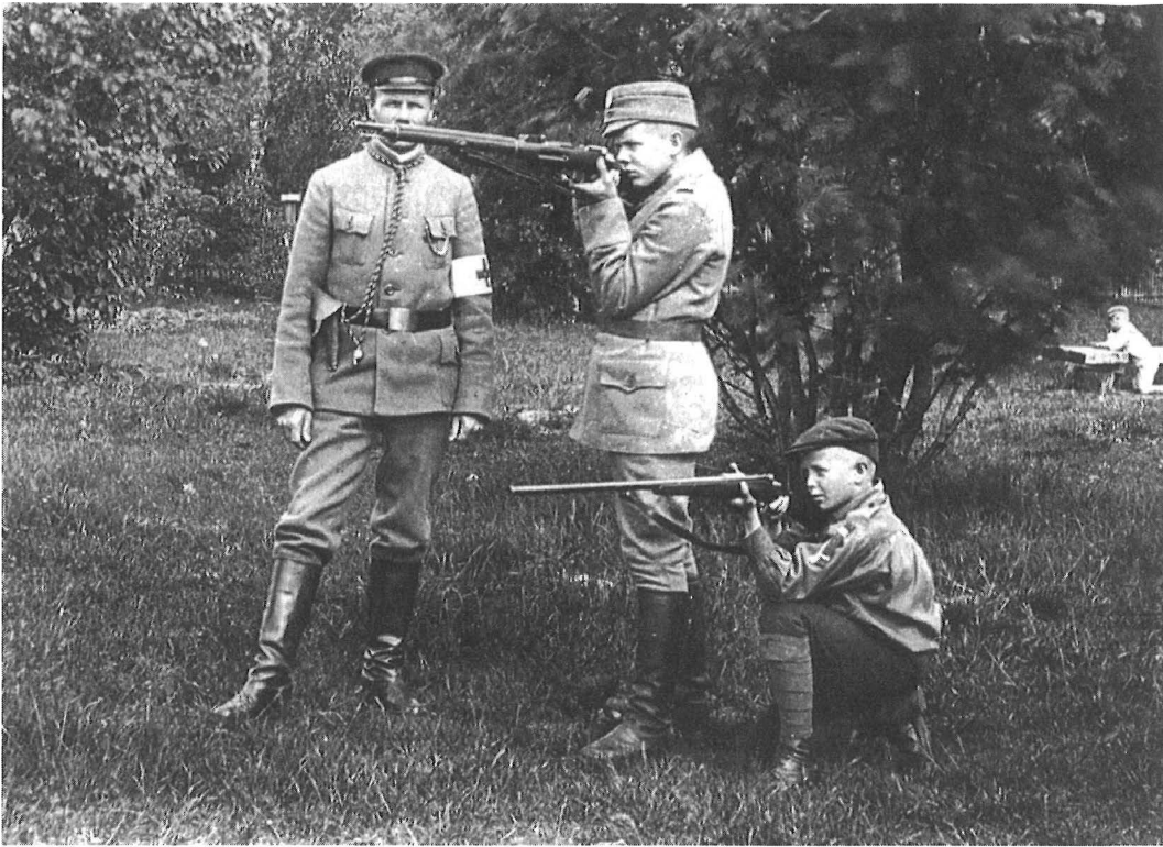
Paperitehtaan työnjohtajan pojat ampumaharjoituksissa Äänekosken Mannilan "kartanon" pihassa 1918. Mannila oli Äänekoski Oy:n mallitila.

muille (Middleton & Edwards 1990, 9). Esimerkiksi seksuaalisuus on suomalaisessa yhteiskunnassa varsinkin lapsuuteen liitettyinä ollut pitkään tabu, josta ei ole puhuttu julkisesti – eikä juuri yksityisestikään. Seksuaalisuutta sivuavien aiheiden selvittely niistä uteleville lapsille lienee edelleenkin monille aikuisille hankalaa (Korkiakangas 1992).