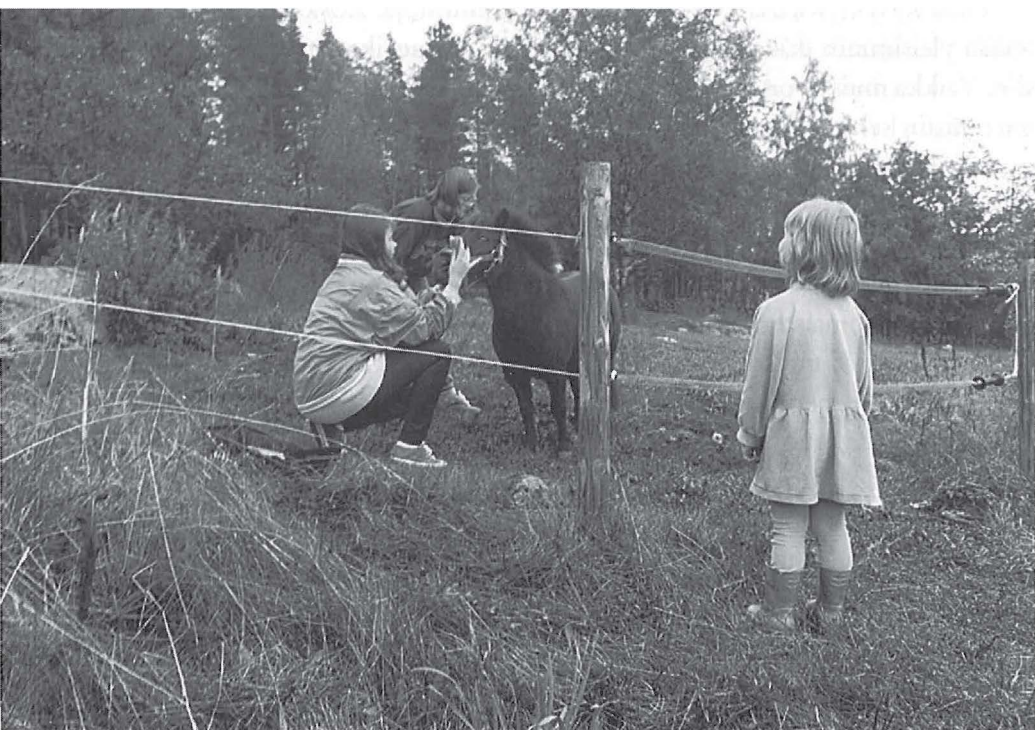
Poninhoitajat. – Kuv. Ulla Lipsanen 1995.