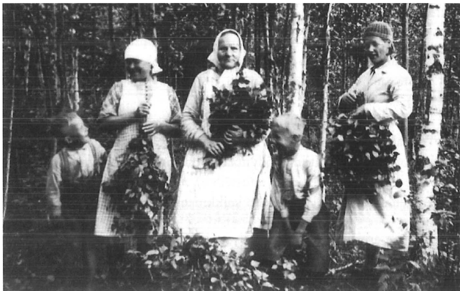
Pojat naisten mukana vastojen teossa 1938.

Minusta kaikki työn oppiminen ja tekeminen oli mielekästä. Ei silloin ollut turhaa kiirettä. Eikä minua koskaan pakotettu työhön. Ja vapaata oli riittävästi. -- Olen suuresti kiitollinen Jumalalle joka antoi minun syntyä hyvään kotiin hyvien vanhempien lapseksi. Olen pitkään elämäni varrella tarvinnut kaikkia kotona opittuja taitoja kouluutukseni lisäksi. Kotini on vanha sukutila --. Ja on vielä samalla suvulla. -- Olin ennen naimisiin menoani opettajana kotipitäjässä. Jouduin seuraamaan lasten elämää. Silloinen lapsijoukko oli "kultaista" sekä lapsuus leikeissään, että koulussa. En muista pahoja lapsia olleenkaan, eikä tarvinnut rankaisua käyttää. Olen vieläkin yhteydessä heihin. Eilen viimeksi sain kirjeen ja lahjan 65 v poikaoppilaaltani. Paha lasta ei synny - aikuiset tekevät heistä hyviä, tai pahoja. Aikuisten esimerkki vaikuttaa. Toivoisin, että äidit hoitaisivat pienenä lapsensa, jos suinkin