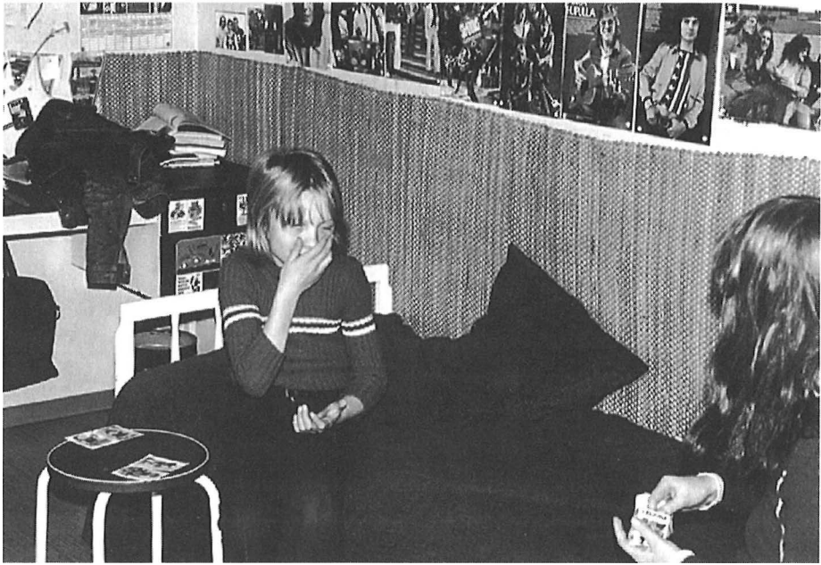
Tytöt ja "hassunkuriset perheet", luvallista kortinpeluuta 1970-luvulla. – Jyväskylän yliopiston etnologian laitoksen kuva-arkisto.

muassa tietokonepelit, jotka eivät kannan samanlaista paheellisuuden taakkaa kuin korttipelit aikoinaan. Eräiden vanhempien mielestä lasten lisääntyvä viehtymys tietokonepeleihin sen sijaan passivoi lapsia, vieraannuttaa heitä muista harrastuksista ja on pohjimmiltaan ilmaus samasta pelihimosta kuin kortinpeluukin. Kotona pelaamista halutaan ja ehkä pystytäänkin rajoittamaan. Lapsilla on kuitenkin yleensä ystäviä, joiden luona he voivat pelata vanhempien kontrolloimatta.