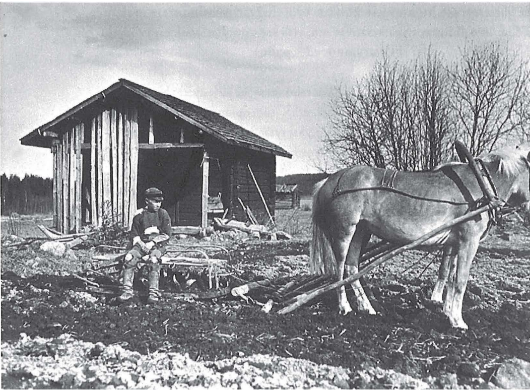
Pellon muokkaaja Konginkankaalta 1920 - 1930-lukujen vaihteesta.