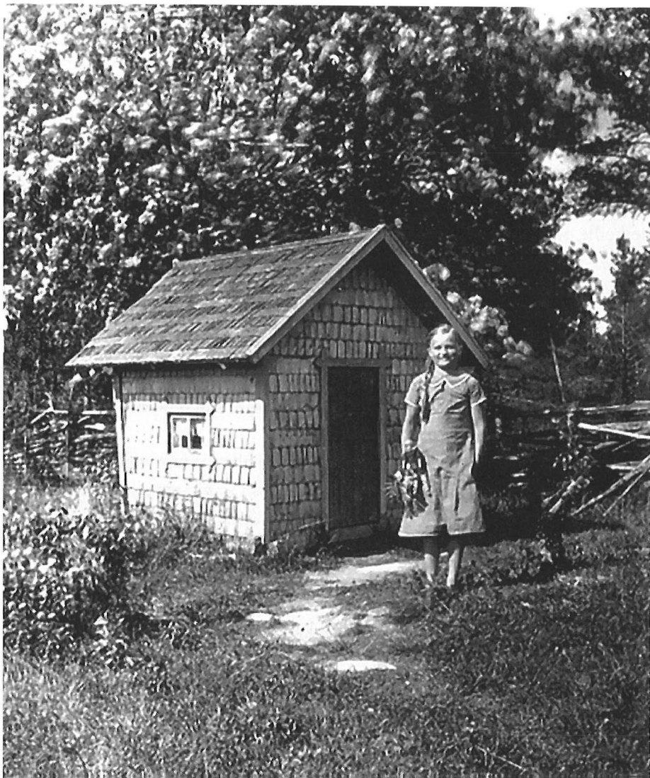
Tyttö päreillä vuoratus "oman tuvan" pihassa. Kuv. Ville Liimatainen 1934. - Keski-Suomen museon kuva-arkisto.

sä on entistä vähemmän lapsia eli mökin tarvitsijoita sekä enemmän asuintilaa, lapsillakin usein omat huoneet. Nykyisin leikkimökki näyttää kuitenkin ikään kuin kuuluvan omakotitalojen pihapiiriin.