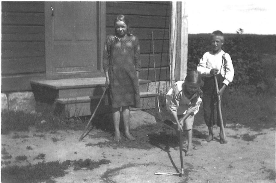
Sirun lyöntiä Konginkankaalla. Kuv. Eino Leskinen 1926. – Museovirasto.

Vuosina 1925-1928 ei ollut kumipalloja. Olin noina vuosina kansakoulussa. Pallot tehtiin villa langasta ja ne olivat ihmeen hyviä pallopelissä. Koulun pihalla oltiin joskus koko koulu samassa pallopelissä, kuningaspallosilla. Siinä oli kaksi kuningasta, isoimmat ja luotetuimmat.