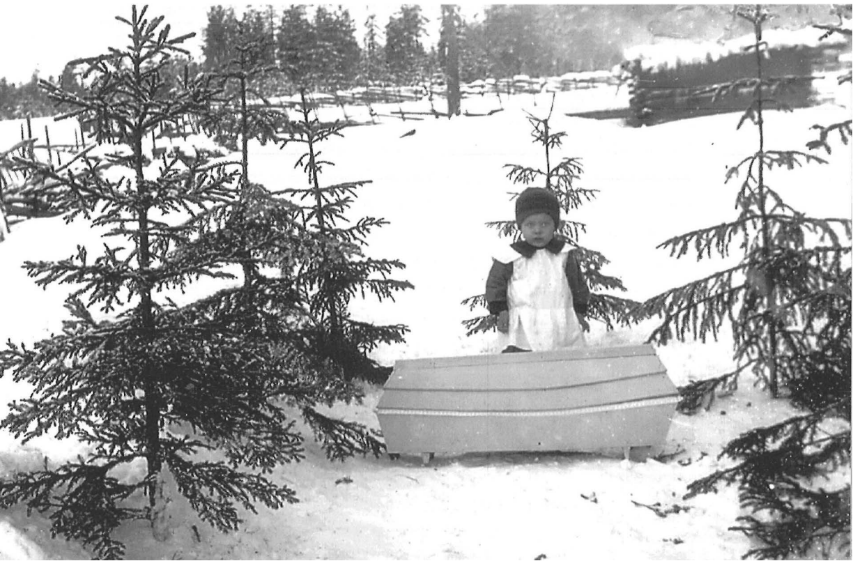
Kuoleman vierailu: sisaruksen arkun äärellä 1920-luvulla.

Sotaleikkien pitäminen sopimattomana on paljolti viime vuosikymmenien mielipiteenmuokkauksen tulosta. Taustalla on monisyinen ja laajem-