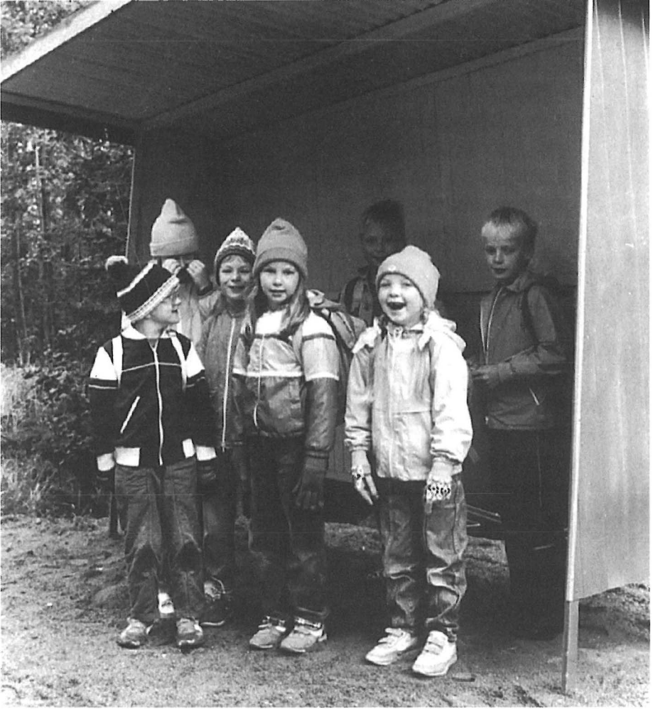
Saarijärven koululaisia kouluautoa odottamassa. Kuv. Sampo-lehti 1986. – Saarijärven museon kuva-arkisto.