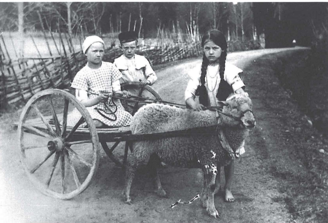
Pässi lasten vetojuhtana.