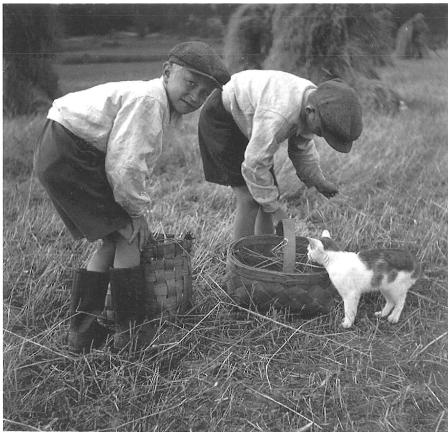
Pojat keräävät tähtkäpäättä leikkuun jäljiltä. Kuv. E. Lyytinen 1933. – Museovirasto.