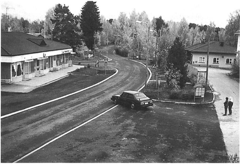
Sumiaisten kirkonkylän muuttunut kylänraitti 1995.