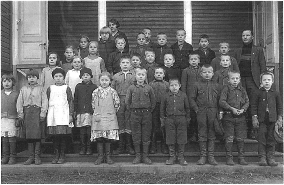
Sumiaisten kirkonkylän koululaisia 1930-luvun alussa.

merkin muistelijä, 1915 syntynyt mies, kertoo kuitenkin kouluajastaan ikään kuin perheen lasten yhteisenä kokemuksena. Sävyltään muistelu on omia tuntemuksia kartteleva, vaikka aikuisten “käskevä ääni” on kaiken aikaa läsnä: