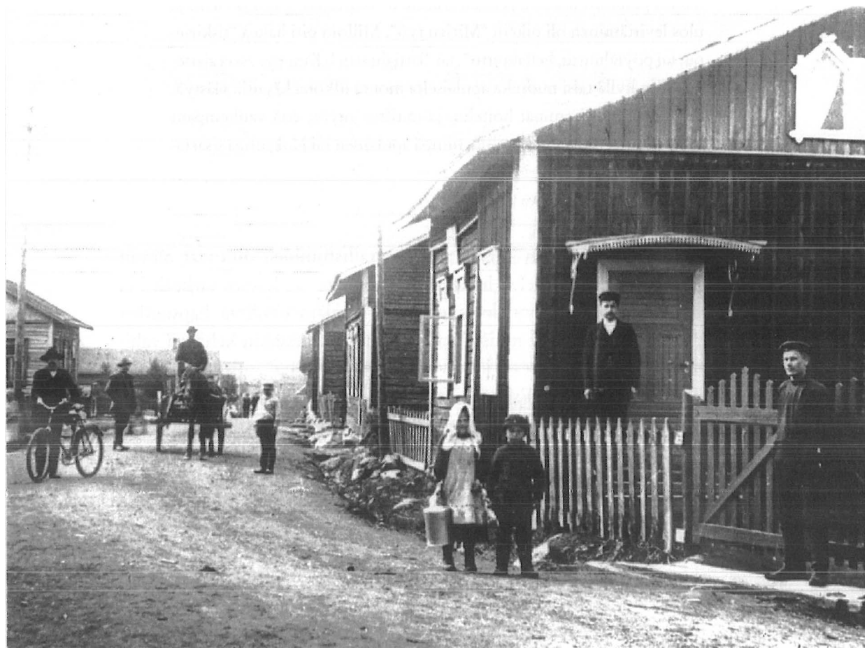
Lapset kauppamatkalla Äänekoskella 1920-luvulla. – Äänekosken kaupunginmuseo.