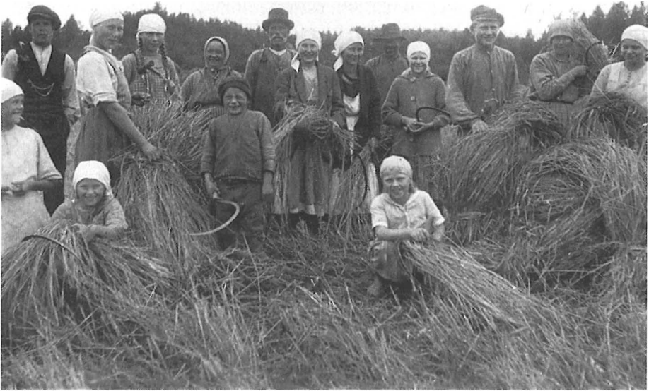
Äänekosken Pohjan talon väki ruispellolla 1925.

qvist (1992, 12) ottaa osaltaan esiin valta-asetelman aikuisten ja lasten välillä mm. seuraavasti: “Det är i gränsområdet, i spänningsfältet mellan vuxen- världen och barnvärlden, som den – ur antropologisk synvinkel – egentliga barnkulturen skall sökas: en kontinuerlig omprövningsprocess i kampen om reviret, om tiden, om positionerna och om tingens betydelser.”