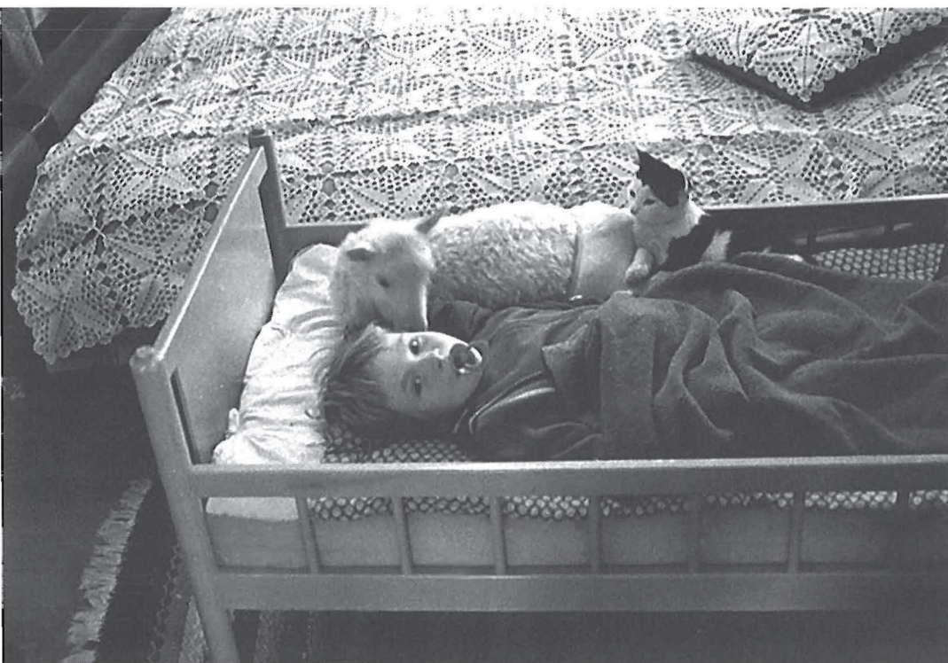
Ystävykset päiväunilla.