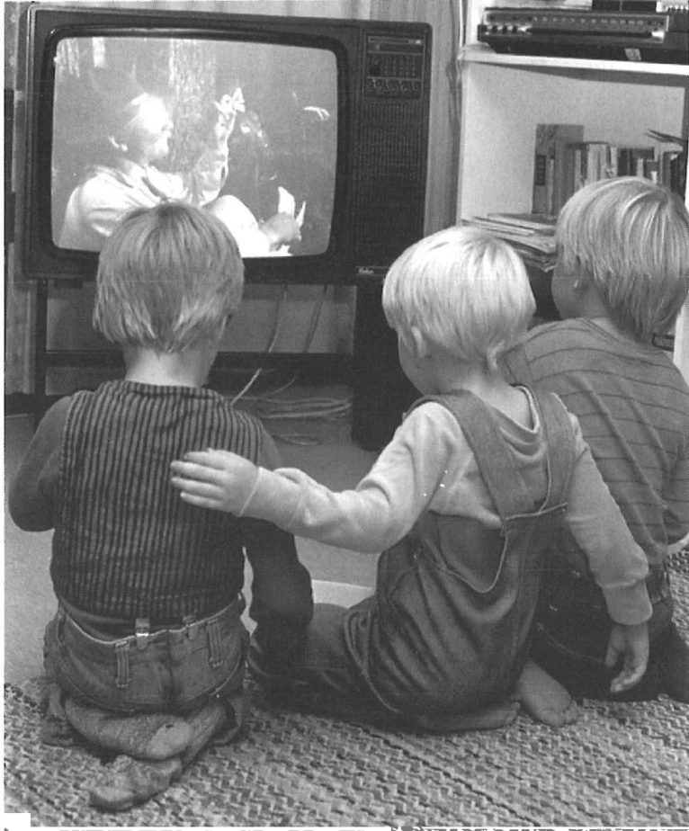
Televison ääressä.