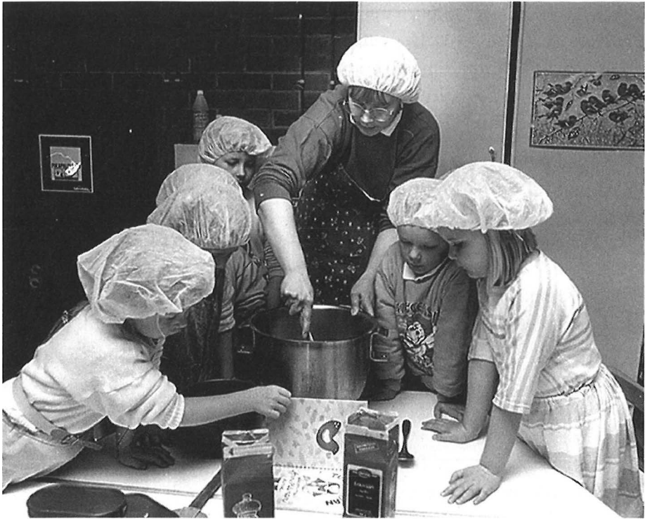
Työtä ja leikkiä päiväkodissa 1990. – Sisä-Suomen Lehden kuva-arkisto.