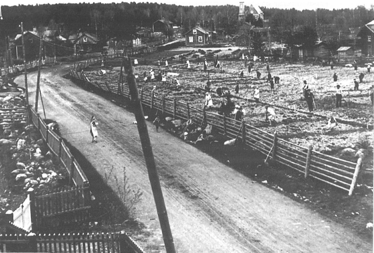
Koululaisia viljelypalstoillaan Äänekosken nykyisen Kauppakadun varrella toukokuussa 1922.