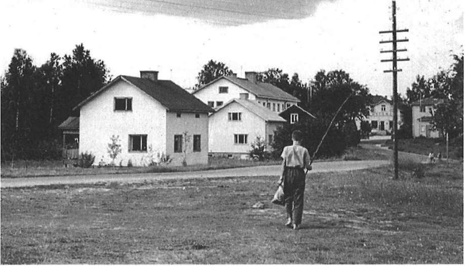
Onkiretkeltä paluu. – Kuv. Olavi Hytönen 1950-luvun lopulla.