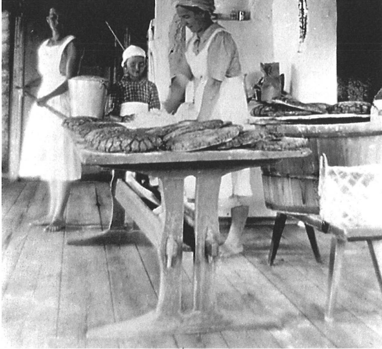
Leivän teon opissa.

muisto kehittyy kerrottaessa eloisaksi muistoksi kertojan elävöittäessä kertomustaan sisällyttämällä siihen itselleen tärkeitä yksityiskohtia: