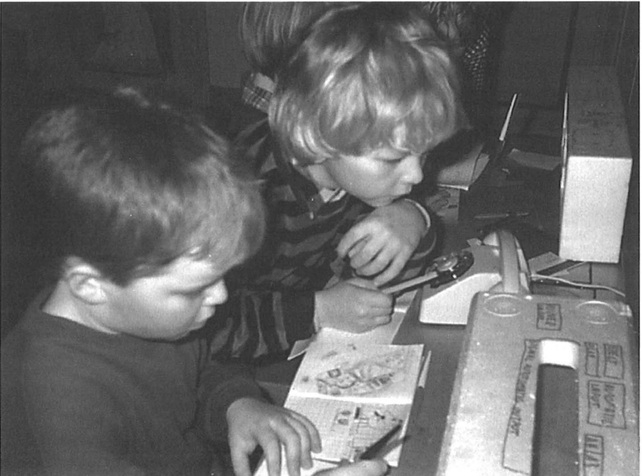
Sumiaisten Rautionmäen koulun poikia koulukyydin odotustunnilla “tietokoneita” ohjelmoimassa. 1988.