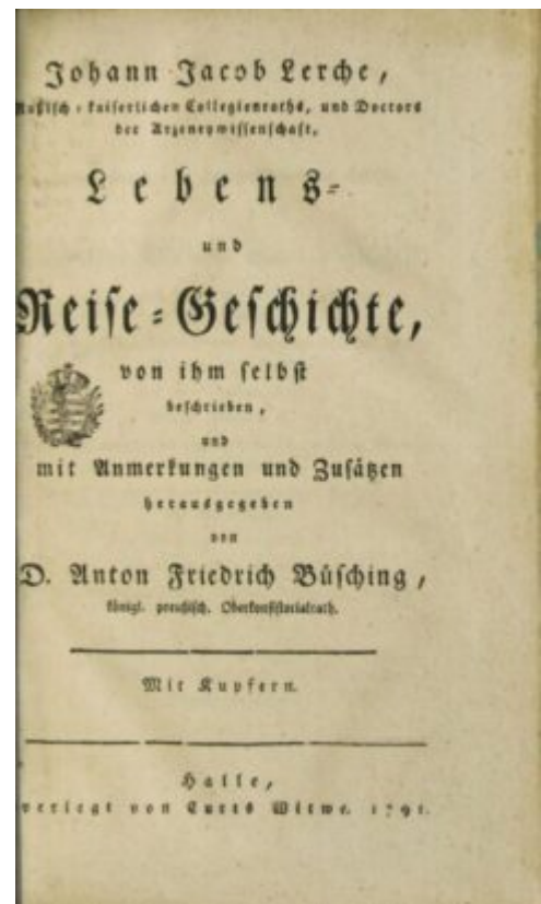
Johann Jacob Lerchen teoksen Rußisch-kaiserlichen Collegienraths, und Doctors der Arzneywissenschaft [...] (1791) nimiösivu.