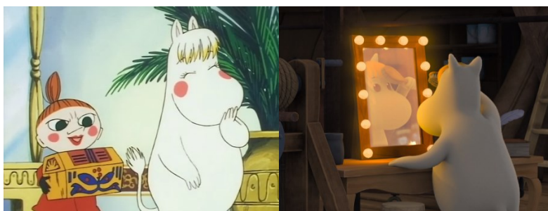
Kuva 3 Ulkonäkö naishahmojen kiinnostuksen kohteena (MT91 & M1.05)

Toisena naiseutta kuvaavana keskeisenä representaationa näyttäytyy ulkonäkökeskeisyyteen asemoituva nainen. Ulkonäön vaalija kuvastaa sellaista naiskuvausta, jossa ulkonäöstä huolta pitäminen näyttäytyy erityisesti naishahmojen toiminnassa ja puheissa heidän omana kiinnostuksen kohteenaan, naisen luontoa kuvaavana tavoitteena sekä pohdintana siitä, miltä he näyttävät muiden silmissä. Ulkonäön vaalija kuvastaa myös pidettyä naiseutta kauniin ulkokuoren tuoden naishahmoille lisäarvoa. Naiskuvan muutos sarjojen välillä näkyy uuden sarjan vähemmän räikeänä ulkonäkökeskeisyytenä, vaikka ulkonäkökeskeisyys keskittyy uudessakin sarjassa edelleen lähinnä vain naishahmojen ympärille.