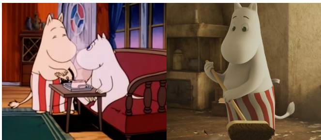
Kuva 1 Äitihahmo kuvattuna hoivan ja kodin piirin kautta (MT58 & M2.10)

Naiseutta on kuvattu ja ymmärretty kulttuurissa kautta aikain äitiyteen liitettyjen hoivan velvollisuuksien kautta. Hoiva, naiseus ja äitiys liitetään erottamattomasti yhteen. (Vuori 2010; 109, 116). Hoivavelvollisuuteen liittyvät kulttuuriset käsitykset todentuvat aineistossani, kun työnjakoa hahmottavista naiseuden kuvauksista paikansin keskeisimpinä kerta toisensa jälkeen lempeää ja rakastavaa hoivaroolia korostavia kuvauksia. Vaikka kuvaus on hallitseva sen saadessa vahvistusta usean hahmon ja tilanteen osalta, haastaa äidillistä hoivaroolia muutamit kohtaukset ja yksi keskeisimmistä naishahmoista. Sarjojen välillä muutosta myös vähemmän sukupuolittuneeseen työnjakoon on havaittavissa, vaikka uudessakin sarjassa naishahmot ensisijaisesti huolehtivat hoivan alueen tehtävistä ja vasta toissijaisesti näyttäytyvät muissa rooleissa.