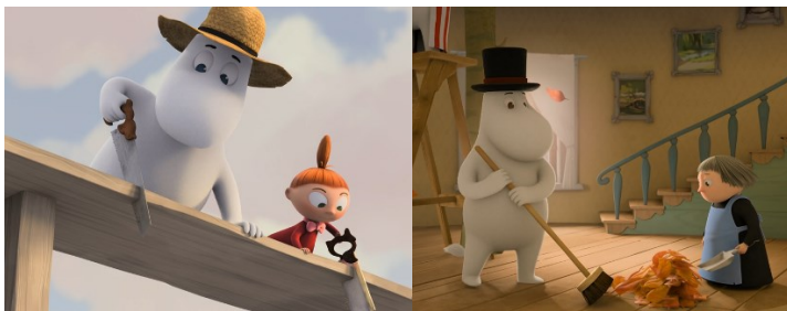
Kuva 2 Sukupuolineutraalimpaa työnjakoa kohti? (M1.01 & M1.10)

Ensisijaisesti roolit pysyvät uudessakin sarjassa sukupuolittuneesti toisistaan eroavina, mutta sarjoja verratessa työnjaon suhteen tapahtuu jonkin verran tasapainottavaa muutosta. Esimerkiksi Mymmeli, jonka hahmo uudessa sarjassa on Myyn äiti eikä sisko, näyttäytyy normatiivisen kodin piirissä taitavan äidin sijaan kömpelönä kodin askareissa. Tähän isähahmo Muumipappa reagoi sanomalla, että taitaa olla hänen vuoro kokata (M3.12). Useammin roolit siis sekoittuvat ja naishahmoja nähdään myös aiempaa sarjaa enemmän osallistumassa esimerkiksi rakentamiseen ja mieshahmoja kotitöissä (kuva 2). Esimerkiksi jaksossa M1.01 Pikku Myy ja jaksossa M2.09 Niiskuneiti nähdään rakentamassa taloa, joka on tyypillisesti liitetty perinteisessä työnjaossa miehille kuuluvaksi työksi. Jaksossa M1.10 Muumipappa ja kodinhoitaja Miska puolestaan nähdään ottavan osaa kodinhoitoon siivoamisen muodossa, joka liitetään tyypillisesti hoivaroolin mukaisesti naisille kuuluvaksi työksi.