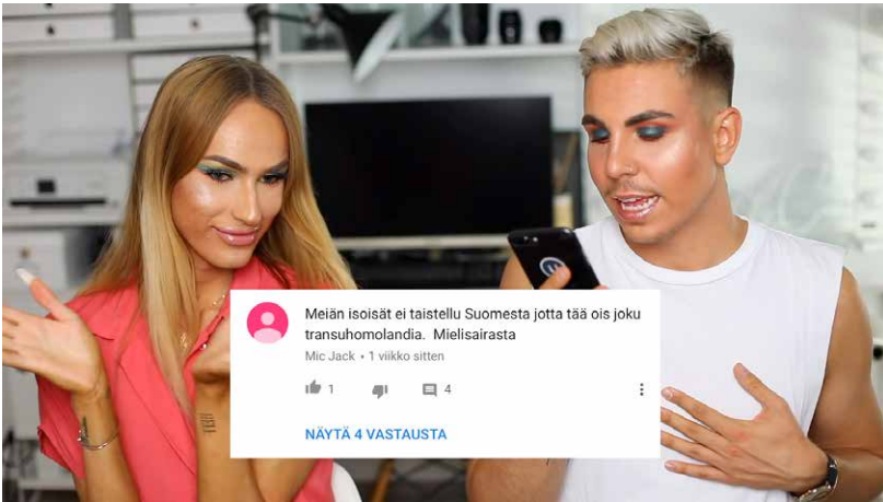
TheSofiaElle ja Valtteri lukevat vihakommentteja (kuvakaappaus, YouTube).

Esimerkki 5: Isoisät taistelivat transihmisten vapauden puolesta