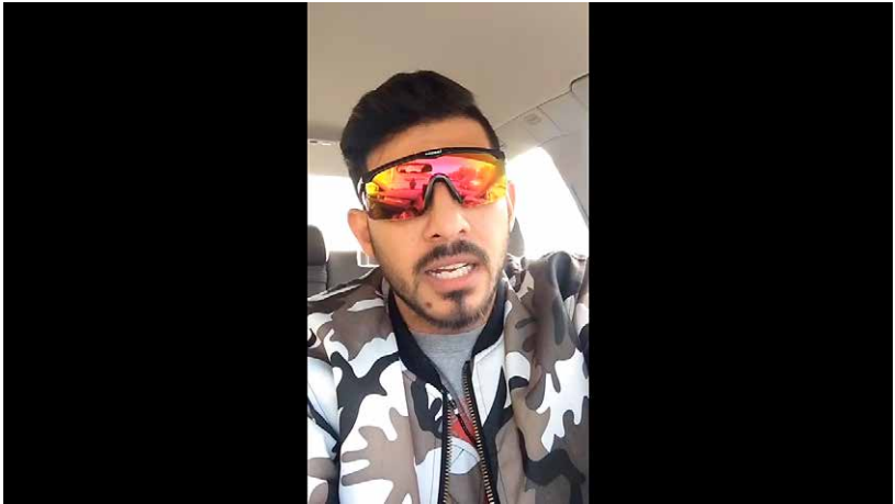
Kilikalin vihainen monologi ulkomaalaisista.

Sosiaalisen median viestintä on heterogeenistä myös siksi, että se on olennaisesti monimodaalista (Sergeant ja Tagg 2014). Puheen ja tekstin ohella kuvien, videoiden, musiikin ja äänen merkitys digitaalisissa käytännöissä on kasvanut jatkuvasti, ja niiden yhdistelmillä ja sommittelulla on oma roolinsa merkitysten rakentamisessa. Myös tekstuaalisten ja muiden semioottisten resurssien kierrättäminen ja uudelleen merkityksellistäminen on hyvin yleistä. Näissä (entekstuaalisaation ja resemiotisaation 3 ) prosesseissa poimitaan esimerkiksi tekstikatkelmia, kielellisiä ilmauksia, kuvia ja videoleikkeitä niiden alkuperäisistä konteksteistaan, sijoitetaan ja uudelleen merkityksellistetään ne osaksi toista diskurssia, toiseen tarkoitukseen ja toiselle kohdeyleisölle. Esimerkki 2, Kilikalihahmon YouTube-esitys, havainnollistaa hyvin sosiaalisen median viestinnällistä heterogeenisyyttä: