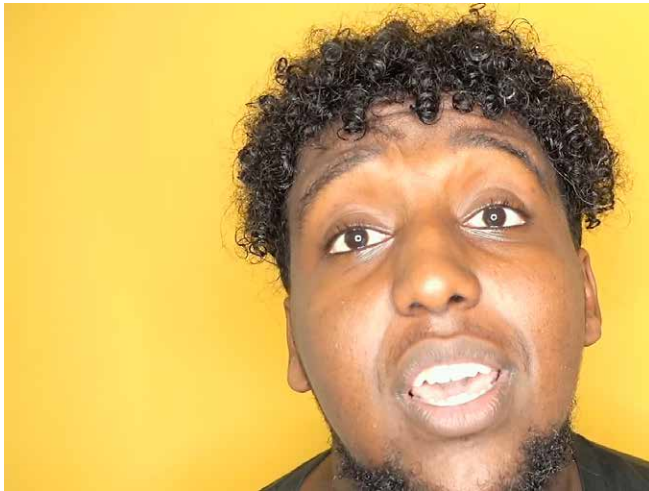
Hassan Maikal ja vastapuhe (kuvakaappaus, YouTube).

Esimerkki 3 puolestaan havainnollistaa sitä, miten sosiaalisessa mediassa voidaan vastustaa ja haastaa hegemonisia ja/tai valkoiseen suomalaiseen nationalismiin liitettyjä kielenkäytön normeja. Esimerkissä Hassan Maikal, somalialais-suomalainen räppäri ja (aiemmin myös) vloggaaja (Leppänen ja Westinen 2018; 2022; Westinen 2019), ruotii saamiaan vihaviestejä YouTube-videolla 4 ja haastaa kommentteissaan normatiivisia oletuksia maahanmuuttajien heikosta suomen kielen taidosta ja kyvyttömyydestä integroitua suomalaiseen yhteiskuntaan.