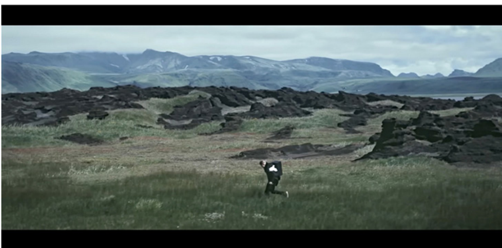
Kuva 3. ”Ääri rajoille”-videon visuaalisuus perustuu vaikuttaviin vuoristomaisemiin, joiden keskellä korostuu artistin yksinäinen hahmo. Kokonaisuus yhdistyy taiteenfilosofiassa subliimin käsitteellä kuvattuihin tunnekokemuksiin. Kuvakaappaus ”Ääri rajoille”-videosta (2014) Liiga Musicin YouTube-kanavalta.