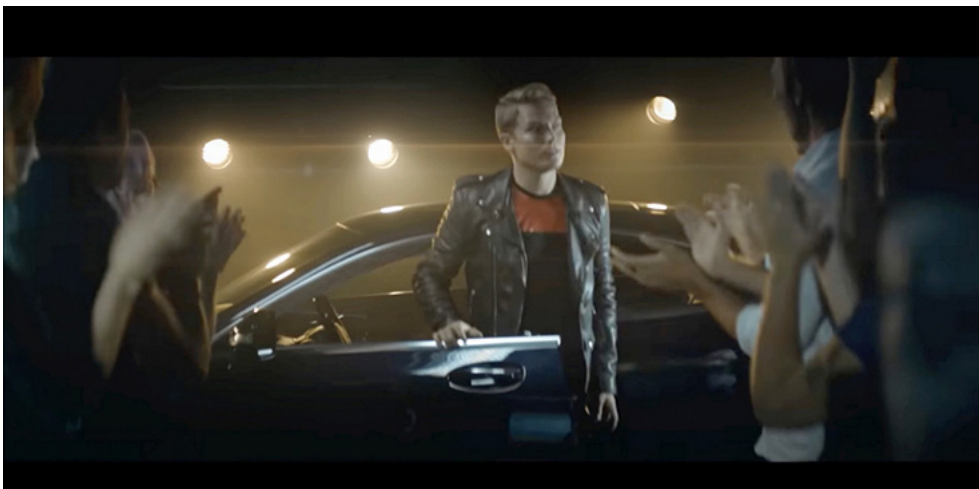
Kuva 5. ”Sä huudat” -video nojaa osin materiaaliseseen rap-estetiikkaan, jossa korostuvat visuaaliset autojen ja ulkoasujen elementit. Sanoitus rakentaa artistirooliin kuitenkin ambivalentin suhteen. Kuvakaappaus ”Sä huudat” -videosta (2015) Liiga Musicin YouTube-kanavalta.