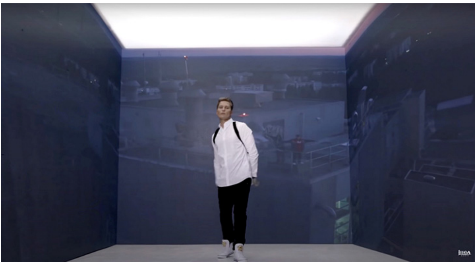
Kuva 6. Cheekin artistiuran viimeinen ”Enkelit”-video on minimalistinen tuotanto, jossa artistia kehystävän avoimen kuution seinille heijastuu elämäkertaelokuvan kohtauksia. Kuvakaappaus ”Enkelit”-videosta (2017) Liiga Musicin YouTube-kanavalta.

”Enkelit”-video on Cheekin artistiuran viimeinen ja edeltäviä esimerkkejä minimalistisempi tuotanto. Kun kahdessa aikaisemmassa musiikkivideoossa korostuu dynaaminen liike, nyt ilmaisuvoima perustuu staattisuuteen, jonka taustalla liike on toisena tarinalinjana. Valtaosan ”Enkelit”-videosta Cheek räppää kappaletta avoimen kuution sisällä. Kuution sisäseinillä kulkee kronologisesti lapsuuden, nuoruuden ja aikuisuuden tapahtumia esittäviä Veljeni vartija -elokuvan kohtauksia, jotka ovat dialogisia sanoituksen kanssa. Elokuvan kohtaukset vaihtuvat toistuvasti myös koko ruudun kuvina ensisijaisen tarinan asemaan. Musiikkivideo yhdistyy jälleen Stockwellin (2020, 199–200) kuvaamaan kontekstiovien kehysten muuntamiseen: hahmon kehukseen sitomisen ja irrottamisen liike heijastaa etenkin liikettä henkilökohtaisten muistojen, uskomusten ja mahdollisuuksien välillä sekä liikkeen tuottamaa muutosta. Niukoilla visuaalisilla ratkaisuilla musiikkivideo luo moniulotteisen hahmon ja tulkinnan taiteenlajiin kohdistuvasta rakkaudesta. Suhteessa taiteilijuuteen kokonaisuudessa korostuu merkitys, jossa matkan varrella reflektoitu taiteenlajiin kohdistuva rakkaus on staattista, vaikka liike (reaalitodellisuudessa myös Cheekin koko artistiura) saavuttaa jonkinlaisen päätepisteen.