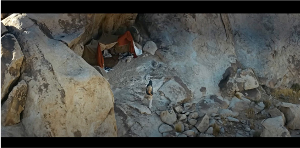
Kuva 4. Cheekin ”Sä huudat” -videon alkuasetelmana on vaikuttava luontokuvasto ja artistin yksinäinen hahmo. Kokonaisuus reflektoi taiteenlajiin kohdistuvaa rakkautta nostamalla esiin ristivedon irrallisuuden ja kuulumisen välillä. Kuvakaappaus ”Sä huudat” -videosta (2015) Liiga Musicin YouTube-kanavalta.

tella kaukaa, lähdin maailmalta hakemaan rauhaa / sairastuin koti-ikävään, siis eiköhän taas aleta naulaa” ja ”mä oon kiertäny palloo etsien Jaree / mutta tuntuu et samalla tavallaan meen ite haneen”.