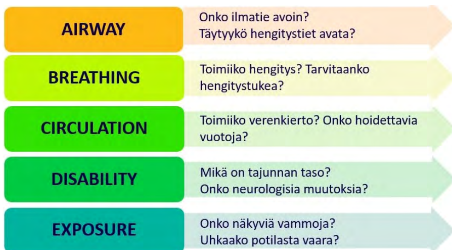
Kuvio 1. ABCDE-toimintamalli kriittisesti sairaan potilaan tutkimisessa.