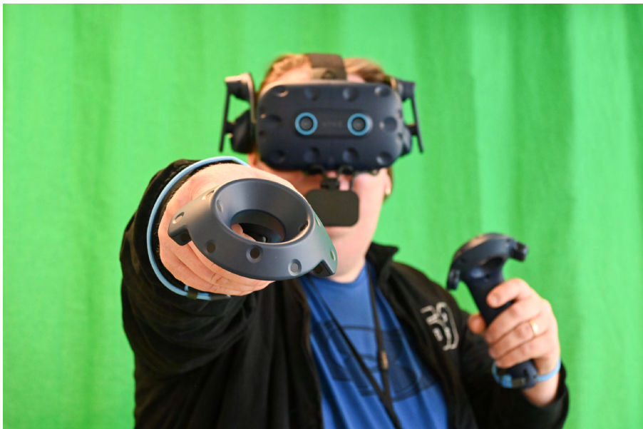
Kuva 1. Harjoittelua ja opiskelua virtuaalioppimisympäristössä.

Sairaanhoitajan opintosuunnitelmiin toivottiin virtuaaliodellisuutta hyödyntäviä opetusmetodeja poikkeuksetta. Opiskelijat kokivat VR-tekniikan mahdollistavan uusia oppimis- ja opiskelumahdollisuuksia monenlaisille oppijoille, sekä rikastuttavan sairaanhoidon opetusta ja opetusmetodeja. Virtuaaliodellisuuden hyödyntämisen opetuksessa uskottiin tuovan työelämää entistä konkreettisemmaksi jo opiskeluvaiheessa, jolloin työelämän erityispiirteiden oppiminen mahdollistuisi saumattomammin.