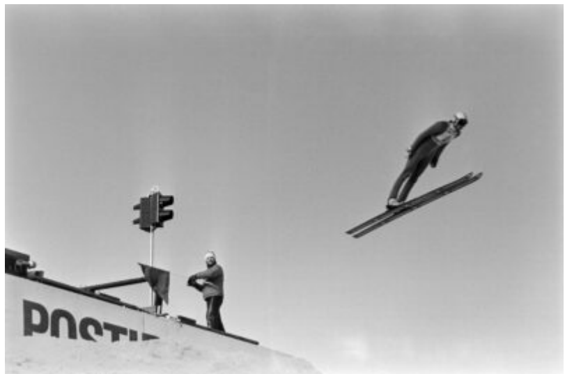
Matti Nykänen Salpausselän kisoissa Lahdessa 4.3.1983.