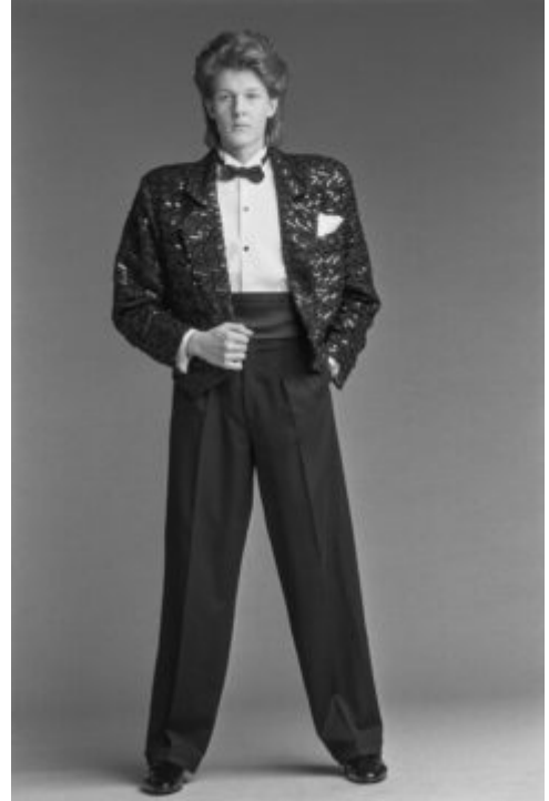
1980-luvun muodissa näkyivät muun muassa olkatoppaukset ja takatukat.

Aerobic-innostuksen myötä naisilla nähtiin jumppapukuja ja säärystimiä, mutta myös muita suosikkilajeja, kuten golfia, tennistä, squashia ja laskettelua varten tarvittiin omat välineet ja vaatteet. Mallia pukeutumiseen voitiin ottaa elokuvista ja TV-sarjoista. Moni muistaa vieläkin Miami Vice -sarjasta bleiserien kääriytyt hihat ja takin alta pilkistävän T-paidan. Kokonaisuuden kruunasi rusketus. Varakkaammat makasivat solariumeissa, mutta myös etelänmatkalta saattoi saada rusketusta ihoonsa.