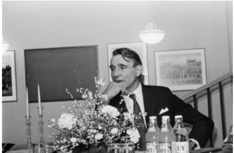
Mauno Koivisto Kotkassa 1986.

Linkki lisenssiin.