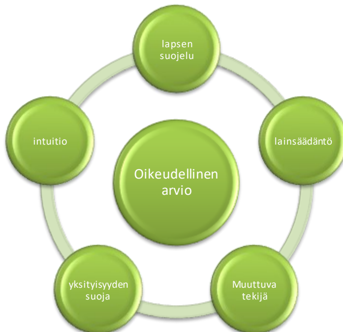
Kuva 1. Oikeudellisen arvioinnin muodostuminen

säädäntöön sekä intuitioon liittyvä puhe rakennettiin toistensa vastakohtina esittämisenä. Vastakohtaisuuksien liittäminen osaksi laajempaa käsitteistöä, mahdollistaa asioiden liittämisen osaksi sosiaalista rakennetta (Alasuutari 2011, 229). Tarkastellessa näitä merkityksiä välittömän vaaran arvioinnin kokonaisuudessa, ne ovat tekijöitä, jotka tukevat lapsen tilanteen oikeudellisen arvioinnin toteutumista. Arvioinnin oikeudellisuus vahvistuu, kun arvioinnin ja päätöksenteon lain soveltaminen ja työntekijöiden harkinta tarvittavista ratkaisuista, noudattavat lainsäädännön eettisiä ja oikeudellisia periaatteita. Rätty (2012, 9–10) argumentoi lastensuojelulain keskeisiä periaatteita. Toimenpiteitä on arvioitava lapsen tilanteessa niin, että lapsen kaltoinkohtelun ja pahoinpitelyn riskitekijöihin puututaan riittävän varhain ja riittävän tehokkailla toimenpiteillä. Ratkaisuja arvioitaessa on ensisijaisesti otettava huomioon lapsen etu ja toteutettava lapsen etua käsittäviä ratkaisuja niin, että huomioidaan pienimmän puuttumisen periaate perheen yksityisyyteen. (Rätty 2012, 9–10.) Rätty'n jäsenitys pienimmän puuttumisen periaatteesta voidaan ajatella kuvastavan oikeudellisen arvion elementtejä. Nämä välittömän vaaran arvioinnin ristiriitaista painetta luovat tekijät voidaan kuvata seuraavan kehän avulla: