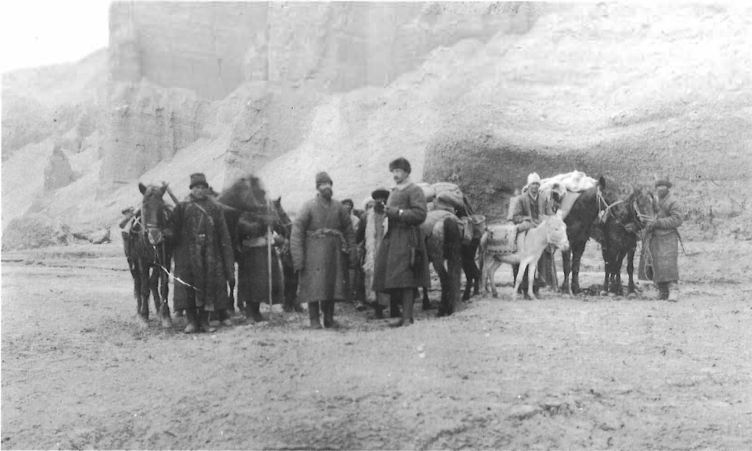
■ Kuva 3 Mannerheim Aasian matkallaan, 1907.

kautta. Näissä uuden kauden näyttelyissä taiteilijoille annettiin entistä vahvempi rooli näyttelyiden suunnittelussa ja sisällön tuottamisessa. Vuonna 2003 museo toteutti ensimmäisen taiteilijavetoisen Afrikka-näyttelyn, jossa antiikin aikaa uudelleen tulkitsevista teoksistaan tunnettu Tero Laaksonen kävi Afrikka-kokoelmaa läpi ja toteutti eräänlaisia rinnakkaisteoksia valitsemiensa teosten tai esineiden pohjalta. 75