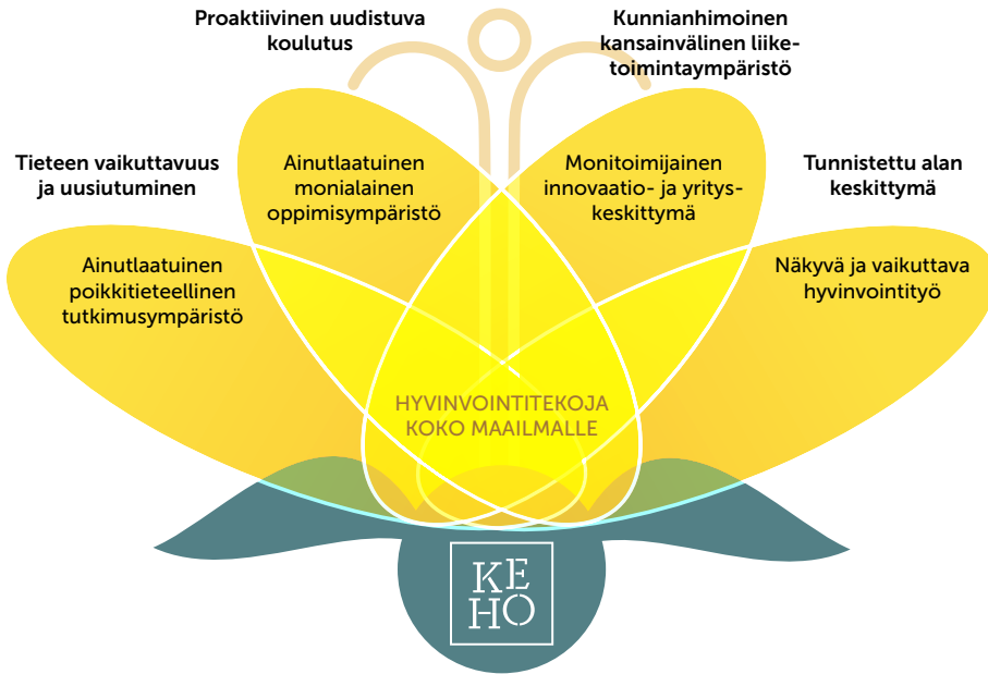
Kuvio 1 Keski-suomalainen hyvinvointiosaaminen tuottaa hyvinvointitekoja ja hyvinvointiosaamiseen pohjaavaa kasvua hyvinvointitalouden toimintamallin mukaisesti. (Kuvio julkaisusta Fadjukoff 2018, 25)