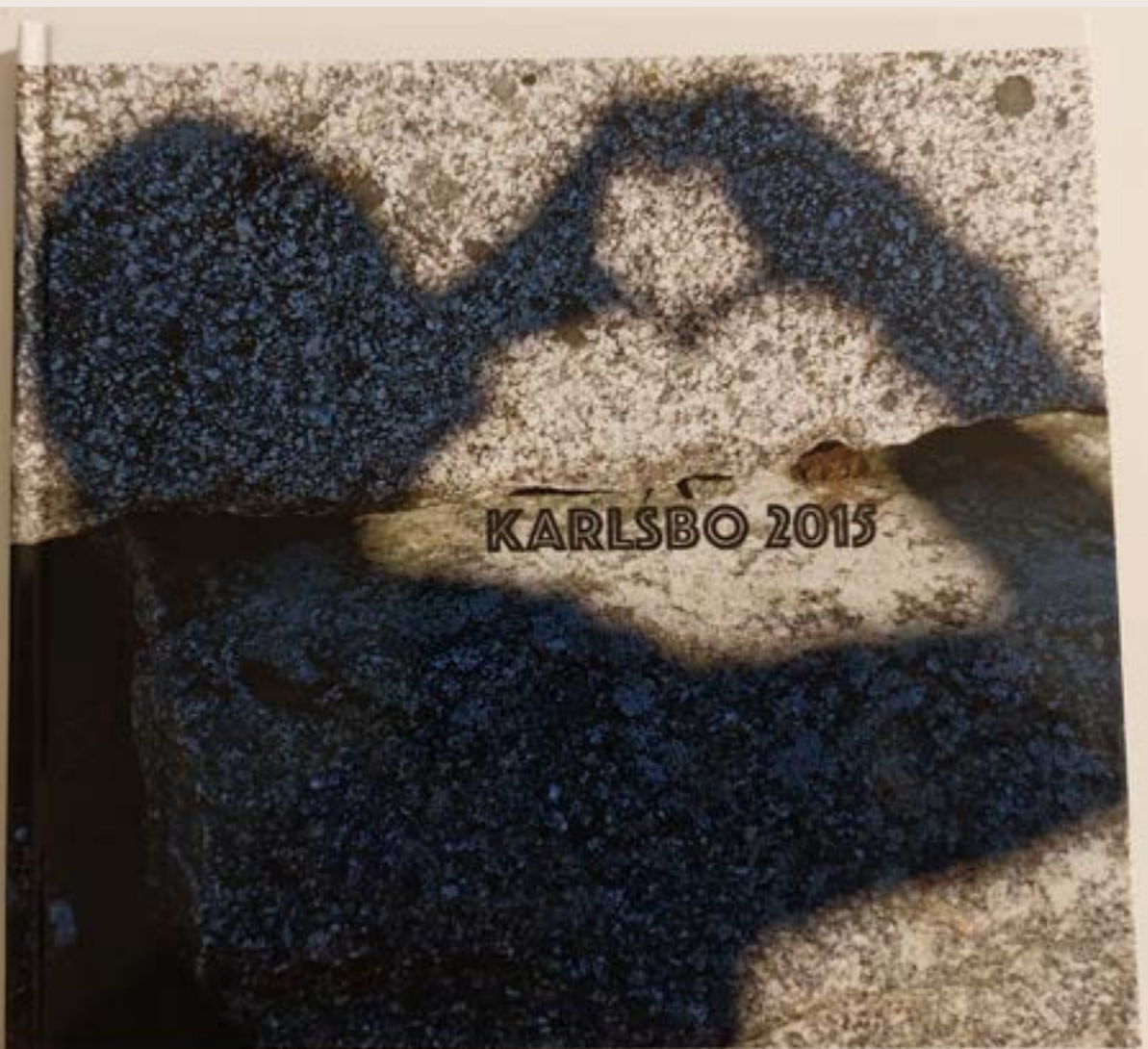
Kuva 1. Valokuva-albumin kansi.