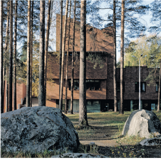
ALVAR AALTO FOUNDATION