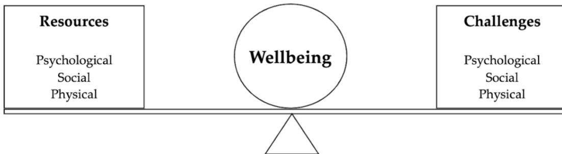
KUVIO 1 DODGEN JA KUMPPANIEN (2012) KAAVIO HYVINVOINNIN TASAPAINOTTELUSTA