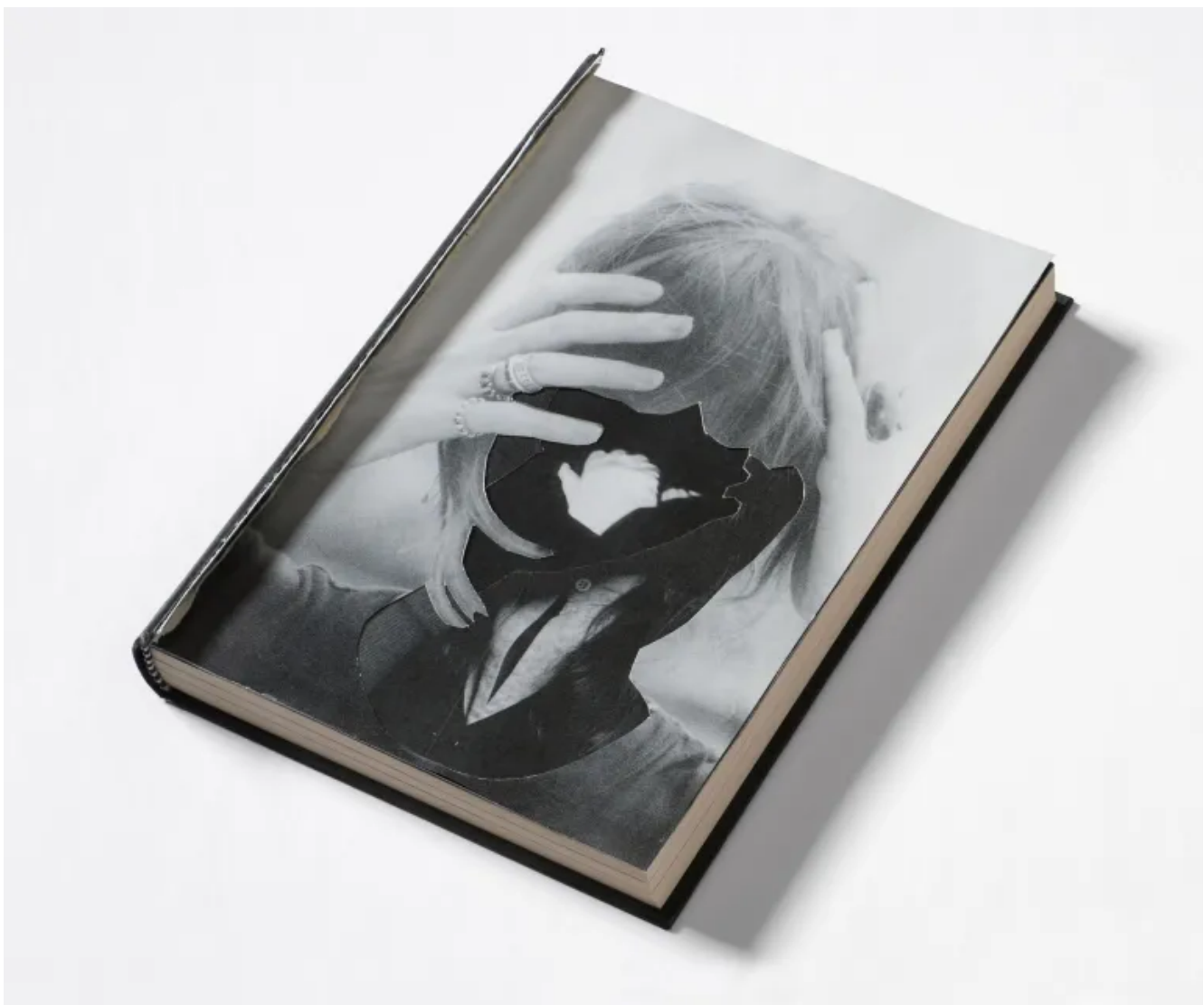
Mika Taanila: Tongue (2017, from the series Film Reader, 218x145x28 mm).

Näin tapahtuu Mika Taanilan teossarjassa Film Reader (2017). Sarjan teoksia on parhaillaan esillä samannimisessä näyttelyssä Turun Ars Novassa. Raaka-aineena on elokuva-aiheisia kirjoja, joita Taanila on muokannut esimerkiksi leikkaamalla ja kaivertamalla. Joukkoon kuuluu hakuteoksia, elämäkertoja, elokuvatutkimuksia, ohjekirjoja elokuvantekijöille ja vastaavaa. Mitään ei ole lisätty, materiaalia on vain vähennetty. Osaa on käsitelty pikkutarkasti skalpellilla, osaa hyökkäävämmiin ampuma-aseella.