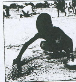
Suomi etäännyttävästi kehitysyhteistyömäärärahoille itse asettamastaan tavoitteesta.

— Se on ollut koko ajan laskusuuntainen, vaikka puheet ovat olleet toista. Mutta en tiedä, turhauttaako. Painavastoin tassa tu-