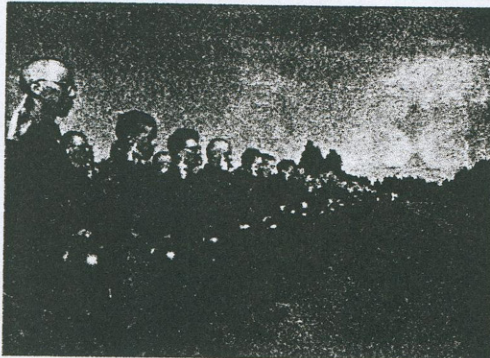
Suomella ei ole varaa varustaa armeijaa muuhun kuin oman maan puolustukseen.