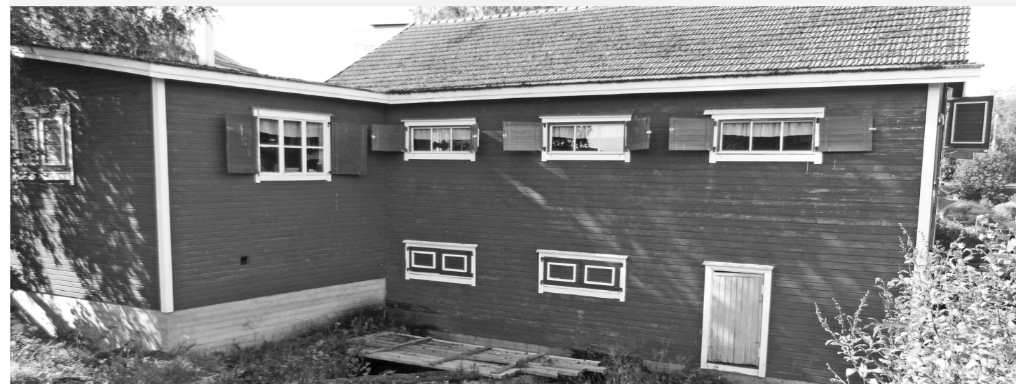
Helaalan vanha mylly Ylivieskassa Kalajoen rannassa.