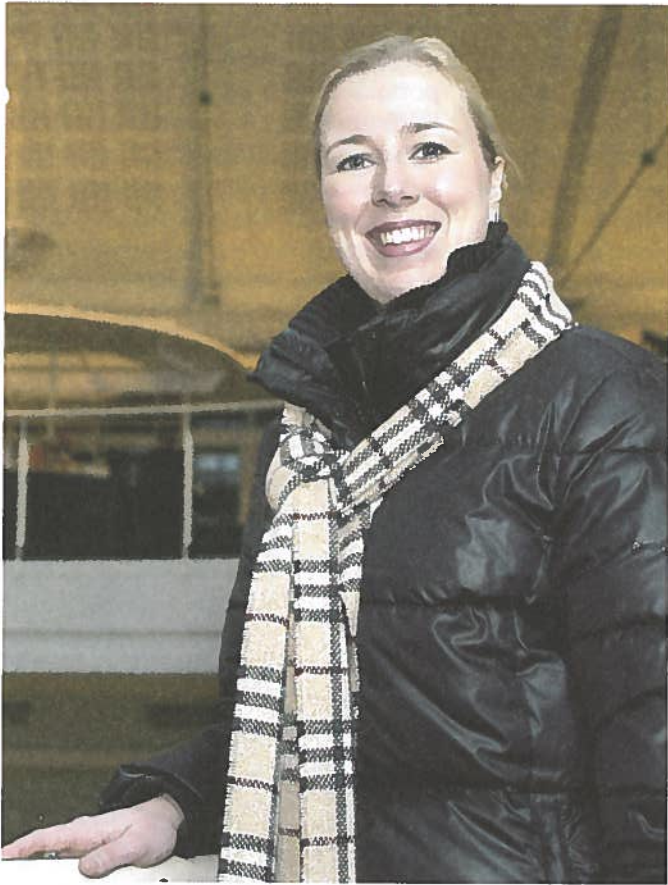
Jutta Urpilainen: "Pidän erittäin hyvänä, että yliopistot joutuvat olemaan nykyistä enemmän vuorovaikutuksessa ympäröivän yhteiskunnan kanssa."