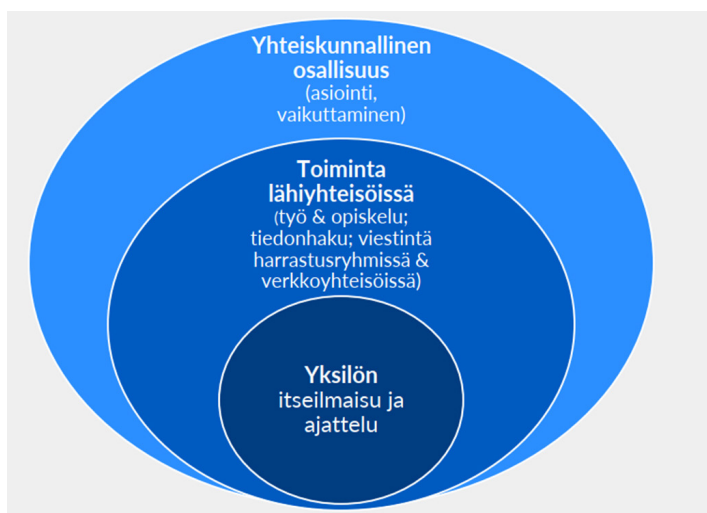
KUVIO 1. Kirjoittamisen keskeiset käyttötarkoitukset.

Kyselyaineiston avovastauksissa kuvatut kirjoittamisen keskeiset käyttötarkoitukset voidaan temaattisen sisällönanalyysin perusteella ryhmitellä kolmeen pääteemaan. Kirjoitustaidon katsotaan ensinnäkin tukevan yksilön itseilmaisua ja ajattelua , vahvistavan toimintaa lähiyhteisöissä sekä mahdollistavan yhteiskunnallisen osallisuuden . Aineistosta nousevat pääteemat on koottu kuvioon 1. Tämä ilmenee teemoitelluista vastauksissa, joissa pohdittiin kirjoittamisen tarpeita (mihin aikuinen tarvitsee kirjoitustaitoa Suomessa), kirjoittamista toimintana (mitä Suomessa asuvan aikuisen pitäisi vähintään pystyä tekemään kirjoittamalla) sekä kirjoittamisen tapoja (missä tilanteissa tai mihin tarkoitukseen Suomessa asuva aikuinen tarvitsee nimenomaan käsin tai digitaalisen kirjoittamisen taitoa suomen kielellä).