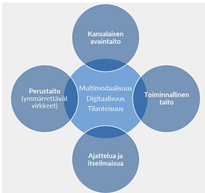
KUVIO 2. Kirjoittamiseen liittyvät taitokäsitykset.

Kirjoitustaito hahmottuu aineistossa ensisijaisesti toiminnallisena taitona ( Pitäisi pystyä kirjoittamaan henkilötietonsa ja mahdollisesti joitain selkeitä lauseita esimerkiksi hakemuksiin yms.; keskeiset tilanteet saa hoidettua ) sekä kykynä ilmaista itseään ja ajatuksiaan ( Osa ihmisistä pärjää hyvin vähällä kirjoitustaidolla, mutta jos taito on heikko, niin se rajoittaa heidän mahdollisuuksia toimia yhteiskunnassa tai ilmaista itseään. ). Tekstittyneessä yhteiskunnassa kirjoittaminen nähtiin myös eräänlaisena kansalaisen avaintaitona , joka turvaa osallistumisen ja vaikuttamisen mahdollisuuksia yhteiskunnan jäsenenä ( hakemuksia ja viestejä viranomaisille; yhteiskunnalliseen vaikuttamiseen [esim. mielipidekirjoitukset, addressit, blogit, some] ). Lisäksi kirjoittamista kuvataan perustaitona , jolloin nähdään tärkeäksi, että kirjoittaja ylipäätään kykenee muotoilemaan ajatuksiaan ymmärrettävästi kirjalliseen muotoon. Suomen kielen tai kirjoitetun kielen normien hallintaa ei vastauksissa sen sijaan juuri käsitellä tai pidetä itsearvoisen tärkeänä ( Ei tarvitse olla kieliopillisesti oikein. ).