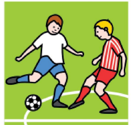
Pelata jalkapalloa.

“Viime tunnilla otin hänet vastaan ihan heti ovelta. Toivotin taas tervetulleeksi, juttelin pari sanaa ja sitten annoin hänelle haasteen: sanoin, että uskon hänen pystyvän olemaan koko tunnin ajan puhelin taskussaan. Ja toden totta! En kertaakaan nähnyt hänellä puhelinta kädessä, vaikka