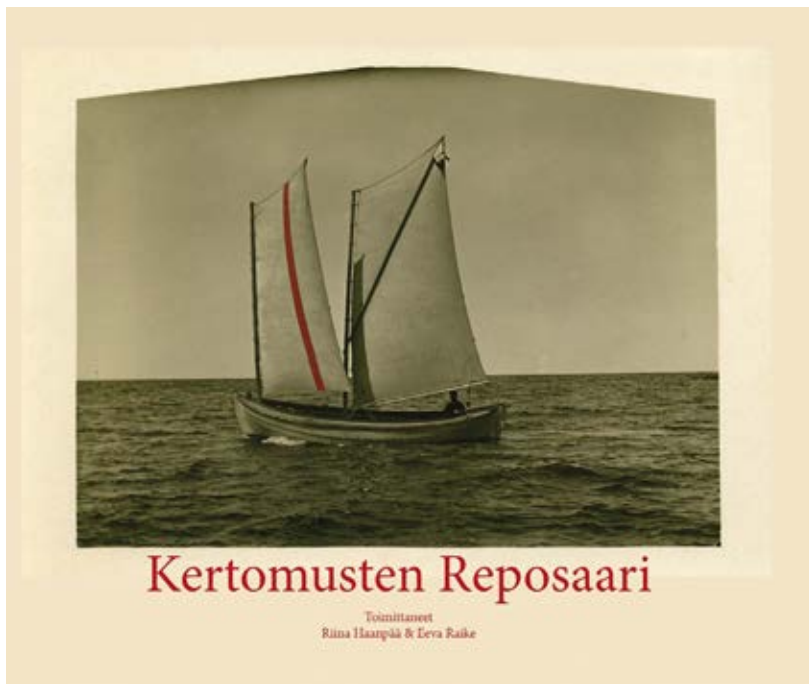
Kuva 6. Kertomusten Reposaari -teoksen kanssi. Kertomusten Reposaari rakentui kokonaisuudessaan yhteisölähtöiseksi prosessiksi, jossa reposaarelaisten panos tiedon tuottajina, tulkitsijoina ja jakajina oli varsin mittava.

Tutkimus julkaistiin teoksena Kertomusten Reposaari (2017). Paikalliset jättivät lopulta jälkensä myös teoksen käsikirjoitukseen toimimalla julkaistaviksi aiottujen tekstien esilukijoina, kommentoijina ja kirjoittajina. Heidän uskonsa hankkeen toteutumiseen oli voimakas, mikä ilmeni myös aivan tutkimushankkeen lopulla, jolloin katoimme vielä keskeneräisen käsikirjoituksen tulevia painokustannuksia ennakkotilaaajien avulla. Tilajat maksoivat teoksen etukäteen luottaen siihen, että teos todella valmistuisi. Teoksen ensimmäinen painos julkaistiin Reposaareissa joulukuussa 2017, ja painos myytiin loppuun kahden päivän aikana.