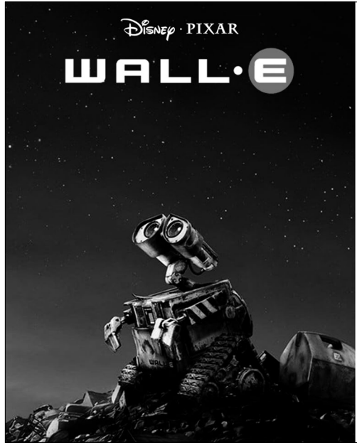
Kuvat 2a ja 2b. E.T. ja WALL-E katsovat ylös kaukaisuuteen (E.T.: https://www.imdb.com/title/tt0083866/mediaviewer/rm1872044032 , WALL-E: virallinen mainosjuliste https://theposterdb.com/poster/465 ).

siitä siirtokuntaan. WALL-E seuraa EVA:a ja he päätyvät Axiomille, alukselle, joka on ihmisten siirtomaa. Kaikki eivät kuitenkaan halua palata maahan, ja niinpä EVA:sta ja WALL-E:sta tulee mutkien kautta etsintäkuulutettuja. Vaikka aluksella kaikki ei sujukaan suoraviivaisesti, siirtokunta palaa lopulta maahan, josta on tullut uudelleen asuttava. Tämä tarina rinnastuu yhteen kristinuskon pyhän kirjan eli Raamatun alkukertomukseen Aatamista ja Eevasta, jotka ovat maan ensimmäiset asukkaat. WALL-E ja EVA ovat mahdollistaneet maapallon uudelleen asuttamisen. Tämä tarina on tuttu ja se luo turvallisuutta ja toivoa – ihmiskunta voi saada toisen mahdollisuuden.