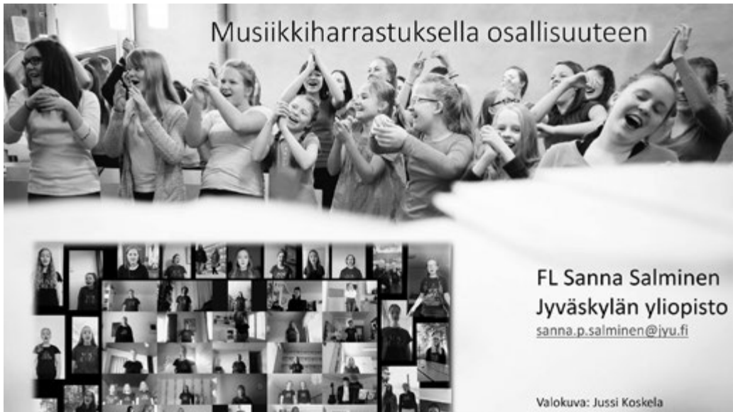
Kuva 1. Vox Aurea -nuorisokuoro.

he noin 25-vuotiaina tarkastelivat musiikkikoulutoiminnan merkitystä oman elämänsä kulussa. Kaikkien samojen oppilaiden tavoittaminen osoittautui kuitenkin mahdottomaksi. Lopulta neljä aikaisempaa musiikkikoulun oppilasta saapui haastatteluun.