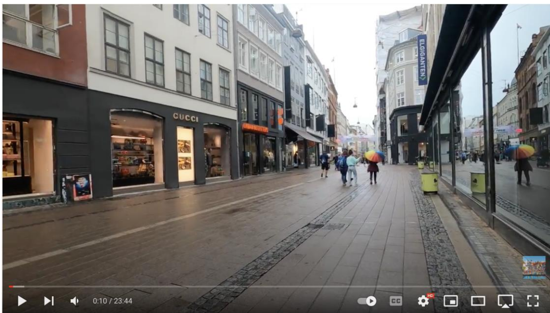
COPENHAGEN, Denmark Virtual Walking 4K/60FPS

https://www.youtube.com/watch?v=xMjbR3GISuM