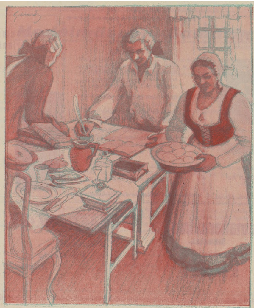
Albert Gebhardin näkemys Tieto-Sanomien tekemisestä vuonna 1776.

ole arvoa tiedon totuudellisuuden arvioinnissa.