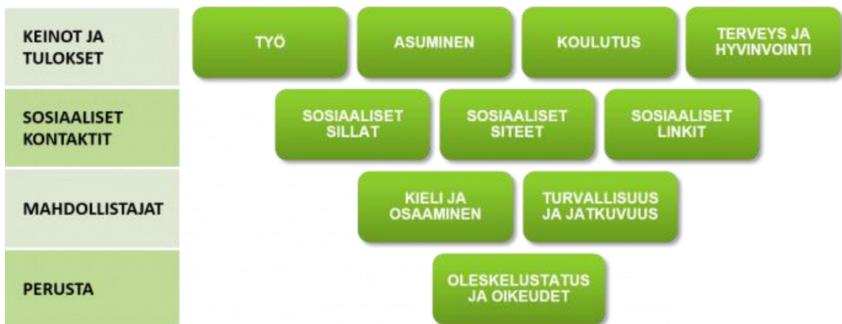
Kuvio 1. Kotoutumisen käsitteellinen viitekehys (Ager & Strang 2008); käännös suomeksi Ritva Mertaniemi (2018)

Ager ja Strang (2008, 169–170) ovat kehittäneet kotoutumisen käsitteellisen viitekehksen, joka käsittelee kotouttamista neljän eri osa-alueen kautta. Jokaisessa neljässä osa-alueessa on yhteensä kymmenen erilaista indikaattoria, jotka vaikuttavat hyvään kotoutumiseen. Osa-alueet ovat perusta (Foundation), mahdollistajat (Facilitators), sosiaaliset kontaktit (Social connections) ja keinot ja tulokset (Means and markers). Suomenkielinen käännös hyvän kotoutumisen kehiksestä on Ritva Mertaniemen (2018) käännös, joka on esitelty ”Hyvä alku Pohjanmaalla-kotoutumishankkeessa.