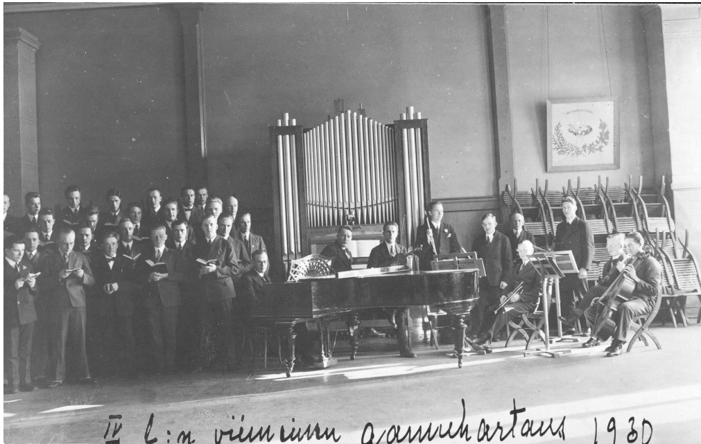
Seminaarin IV luokan viimeinen aamuhartaus vuonna 1930 vanhassa juhlasalissa.