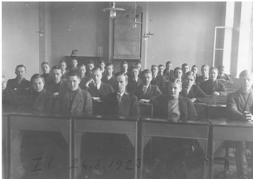
Seminaarin I luokka 26.3.1923. Nykyään huoneella on merkintä S305.

Niin kuin mä mainitsin, kerran viikossa oli se suuren kuoron harjoitus, ni se oli nimenommaan tässä juhlasalissa silloin, et muuta... no sitten ihan tavallisia luokkahuoneita oli nämä sitten kahta puolen käytävää... (AJ.)