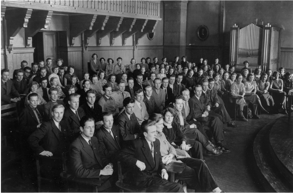
Kuvassa JKK:ssa v. 1952-1954 opiskellut kurssi vanhassa juhlasalissa.

Soittokoppeja sijoitettiin JKK:n aikana myös juhlasalirakennuksen alakertaan, tiloihin joissa ennen sijaitsi harjoituskoulun veistotila. Harjoituskoululuokka sijaitsi nykyisen Cygnaeuksen huoneen paikalla.