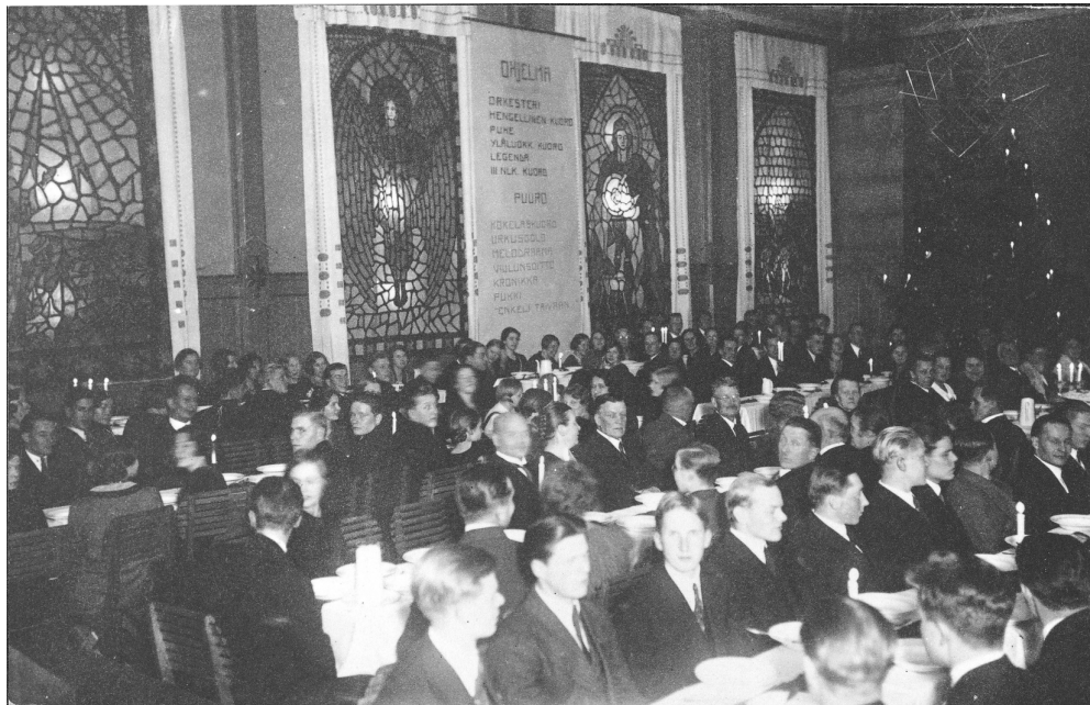
Seminaarin joulujuhla vanhassa juhlasalissa vuonna 1932.

Miespuolella oli tavallisuuden mukaan joulukuusi ja siellä oli opettajat ja oppilaat. Et usko kuinka juhlasali näytti kauniille, kun ulkoa katsoi; se oli kuin liekissä koko rakennus. Siellä juotiin teetä ja laulettiin. (Durchman-Kokko 1963, 71.)