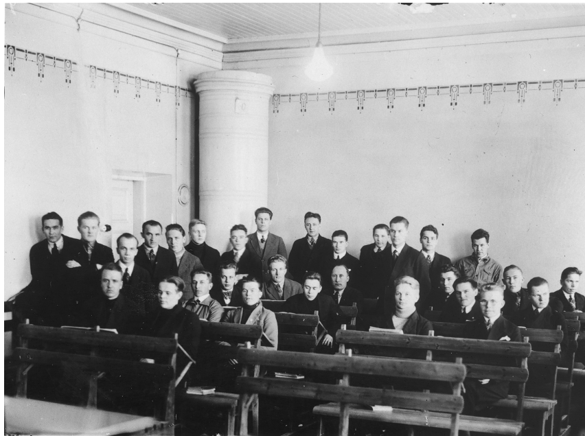
Seminaarin III luokka 1930-1931. Nykyään huoneella on merkintä S120.