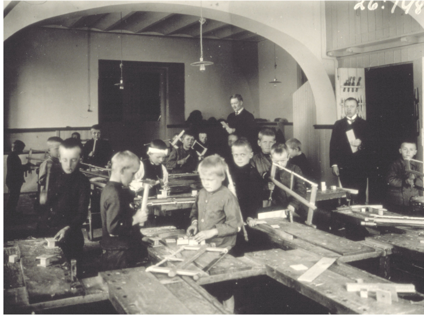
Poikien mallikoulun veistotunti seminaarin aikana. Kyseinen tila on nykyinen yliopiston museon kulttuurihistoriallisen osaston näyttelytila. Huoneella on merkintä S110.