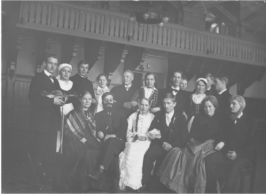
Purppurin esittäjät toverikunnan kokouksessa 15.2.1915. Kun toverikunnat yhdistettiin, niiden kokouksissa esitettiin esimerkiksi kansantänhujä ja ”myöhemmin esitettiin jo purppurikin”. Toverikunta piti kokouksiaan vanhassa juhlasalissa, jossa tämäkin kuva on otettu.