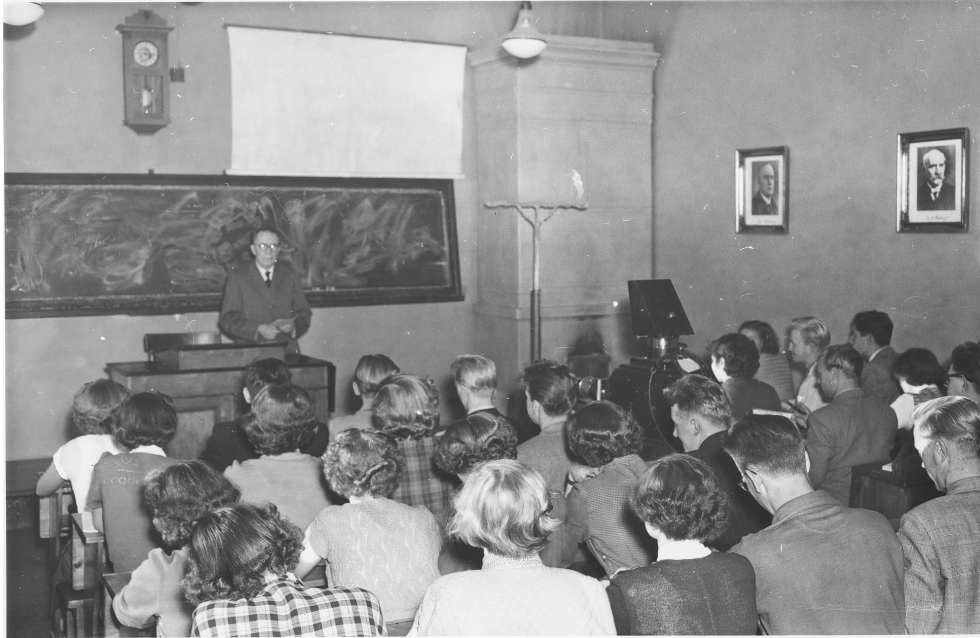
Martti H. Haavion luento JKK:ssa syksyllä 1952 huoneessa, jolla on nykyään merkintä S305.