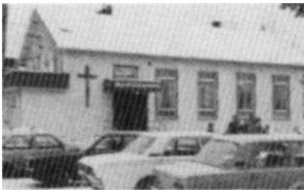
Kuva 4.1. Vanha Betania