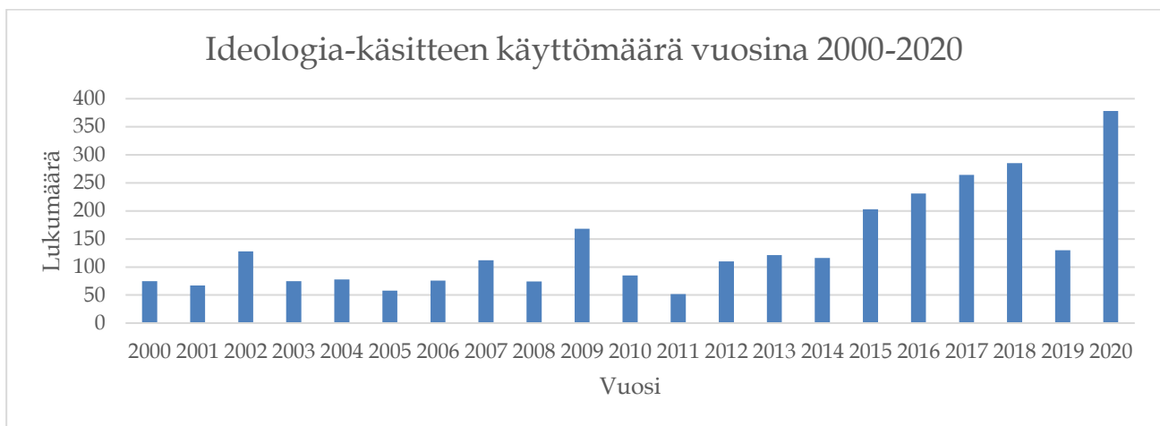
Kuvio 2. Ideologia-käsitteen käyttömäärä eduskunnan puheenvuoroissa aikavälillä vuosina 2000–2020.

Ideologia-käsitteen käyttö eriteltiin myös aikavälille 2000–2020, jotta käsitteen kehitys hahmottuisi selkeämmin. Tätä esittää Kuvio 2, jossa X-akselilla on kuvattu vuodet ja Y-akselilla käsitteen käyttö lukumäärittäin.