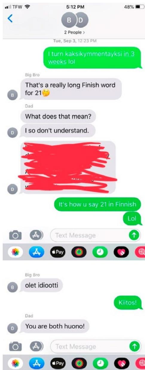
KUVA 3. Owenin perheen chat.

Owen kirjoittaa, että hän toisinaan chattelee perheensä kanssa suomeksi huolimatta siitä, että nämä eivät osaa suomea. Kuva 3 on kuvakaappaus Owenin keskustelusta isänsä ja veljensä kanssa (sotkettu kohta on Owenin oma lisäys).