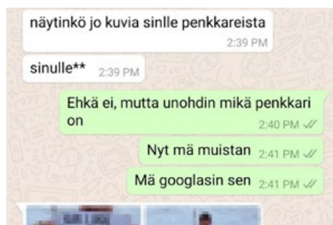
KUVA 2. Veran (oikealla puolella) sekä Maijan (vasemmalla puolella) välinen WhatsApp-keskustelu

Vera on asunut aiemmin Suomessa ja nyt hän on pitänyt yhteyttä suomalaiseen ystävänsä Maijaan chattailemalla. Oheinen esimerkki on ote pitkästä keskustelusta.