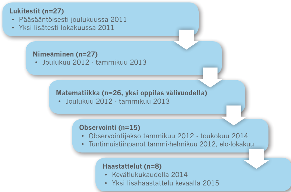
Kuvio 1: Tutkimuksen kulku.

Tutkimuksessa löytyi viisitoista oppilasta, joilla oli vaikeutta yhdessä tai useammassa testissä. Testien perusteella haastatteluun valikoitui kahdeksan eri-ikäistä ja