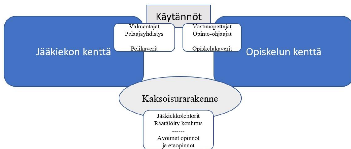
KUVIO 3. Ammattijääkiekkoilijan kaksoisuran kenttä

Yksilön eri ominaisuudet eli pääomat ovat merkittävässä osassa kaksoisuran rakentumisessa. Tämän lisäksi yhteiskunnan rakenteilla on yksilön toimintaa ohjaava vaikutus. Aineistoanalyysin toisessa osassa keskitynkkin kaksoisuraan vaikuttavien rakenteiden ja niiden vaikutusten tunnistamiseen. Suomalaiselle kaksoisuraympäristölle on tyypillistä, että opiskelu- ja urheilujärjestelmät toimivat toisistaan melko erillisinä. Bourdieun teoretisoinnin mukaisesti tarkastelen näiden kenttien yhteensovittamisen mahdollisuuksia.