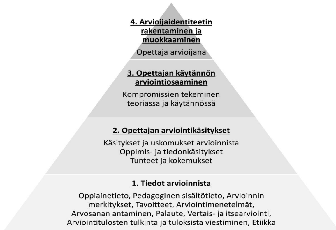
Kuvio 1: Opettajan arviointiosaamisen osa-alueet (Xu & Brown, 2016)

Opettajien arviointiosaaminen (assessment literacy) on moniulotteinen kokonaisuus. Xun ja Brownin (2016) mukaan sen perustana ovat tiedot arvioinnin menetelmistä, merkityksistä ja etiikasta (Kuva 1). Näiden päälle rakentuvat opettajan oppimiseen ja arviointiin liittyvät käsitykset, uskomukset ja tunteet. Arviointiosaamisen kolmas taso kuvaa käytännön arviointiosaamista, mikä tarkoittaa kompromissien tekemistä sekä teoriassa että käytännössä omien uskomusten, käytännön tilanteiden ja virallisten vaatimusten välillä. Arviointiosaamisen neljäs ja korkein taso on oman arvioijaidentiteetin tiedostamista ja rakentamista. Arvioijaidentiteetti ei ole luonteeltaan pysyvä, vaan se vaatii jatkuvaa päivittämistä, erityisesti silloin, kun esimerkiksi opetussuunnitelmassa tai pedagogiikassa tapahtuu muutoksia.