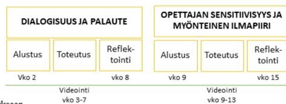
Kuvio 2. Esimerkkejä VOPA-toimintamallin soveltamisesta opettajankoulutukseen