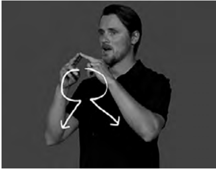
KUVA 2. Kansainvälinen-viittoma (muokattu kuva: viivoja lisätty). Suvi, suomalaisen viittomakielen verkkosanakirja, 2013 (kuva on otettu artikkelin 2260 videosta).

Tulkkaukset ovat Monalle ja Omarille uusia käytänteitä ja kokemuksia. Tulkkaustilanteessa, jossa käytetään kansainvälistä viittomista, käytetään Suomessa useimmiten kahta tulkkiä: kuuleva viittomakielen tulkki viittoo suomalaisella viittomakielellä ja kuuro tulkki kääntää sen kansainväliselle viittomiselle. Alla olevassa esimerkissä (3) keskusteltiin tulkkauksesta, jossa käytettiin kansainvälistä viittomista. Olin kiinnostunut siitä, kumpaa kieltä oli heidän mielestään helpompaa ymmärtää: suomalaista viittomakieltä vai kansainvälistä viittomista.