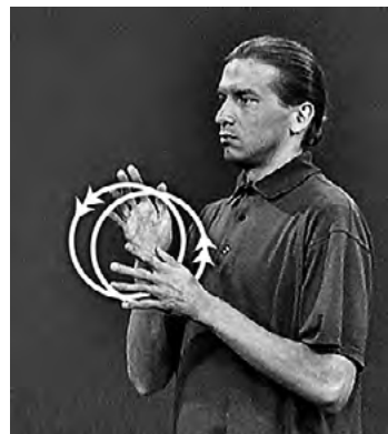
KUVA 1. Viittoa (Suvi, suomalaisen viittomakielien verkkosanakirja: artikkeli 1003. 2013).