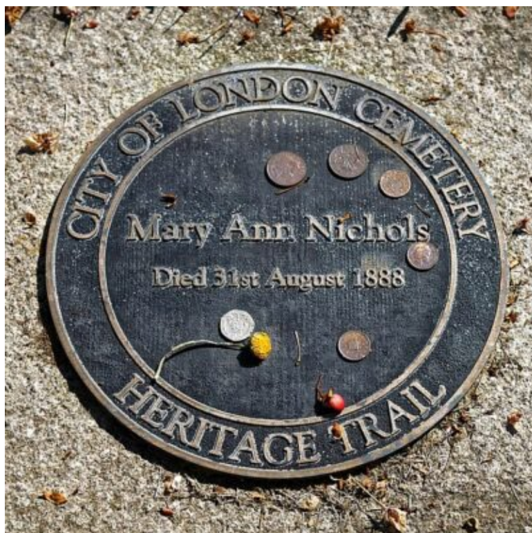
Mary Ann Nicholnsin hautakivi Lontoon kaupungin hautausmaalla.

olla itsestäänselvyys kaikessa ihmisiä koskevassa tutkimuksessa. (Ks. esim. Kuula 2006). Erytystä varovaisuutta ja hienotunteisuutta tarvitaan etenkin silloin, kun kyse on sellaisista arkaluonteisista asioista kuten seksuaalisuudesta, terveystiedoista, sairauksista tai väkivallasta. Tutkijan ei koskaan pitäisi vulgarisoida tutkimuksensa kohdehenkilöitä, vaikka taustatarina ja aikaisempi tutkimus antaisivatkin siihen runsaasti mahdollisuuksia.