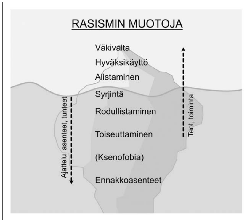
Kuvio 2: Rasismien ilmenemismuotoja.

Vuosina 1995–2000 tehdyt mediaa koskevat tieteelliset tutkimukset havaitsivat, että suomalaislehdissä vähemmistön edustajat esiintyivät useimmiten negatiivisessa valossa eikä heitä pidetty varteenotettavina asiantuntijoina edes heitä itseään koskevissa asioissa (Raittila & Vehmas 2005, 29–30). Tämän jälkeen todettiin, että ”avointa rasismia” ilmeni kuitenkin harvoin ja yleensä yleisönosastokirjoituksissa. Tämä johtopäätös, jonka mukaan suomalaislehdissä ilmenee ”harvoin avointa rasismia”, on jäänyt toistumaan media-alan tutkimuskirjallisuuteen. Ajatuksen taustalla on kyse rasismien jaottelusta avoimeen ja piilorasismiin. Avointa rasismia ovat selkeät rassistiset tapaukset, kuten väkivalta, tahallinen syrjintä ja suorasanainen nimittely. Vaikeammin havaittavat rasismien muodot – joista mediasisällön tehnyt toimittaja ei itsekään ole välttämättä tietoinen – ovat piilorasismia. Lehtiteksteissä ilmenevä vähemmistön vähättely ja ohittaminen ovat tämän jaottelun mukaisesti piilorasismia. Ongelma on se, että samaan aikaan kun tutkimukset luokittelevat nämä rasismien muodot ei-avoimiksi, ne jättävät niiden kohdalla pois termin rasismi ja ryhtyvät puhumaan esimerkiksi toiseuttamisesta tai me–he-asetelmista. On hyvä, että tekstit yksilöivät aiheensa tarkemmilla alakäsitteillä, mutta olisi yhtä lailla tärkeää mainita, että näissäkin tapauksissa on kyse rasismista. Muutoin syntyy vaikutelma, että on olemassa oikeaa rasismia ja sitten muita, vähemmän vakavia ilmiöitä.