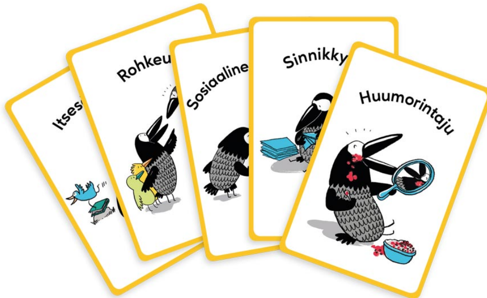
Kuva 1. Huomaa Hyvä! -materiaaleja.

Kaisa Vuorisen ja Lotta Uusitalo-Malmivaaran (2015–2019) Huomaa Hyvä! -sarjassa esitetään luontevahvuuksia sekä niiden tunnistamis- ja hyödyntämistapoja. Huomaa Hyvä! -sarjaan kuuluu neljä osaa: Huomaa hyvä! -kirja luontevahvuuksista (2015), Huomaa hyvä! -toimintakortit (2015), Huomaa hyvä! Vahvuusvariksen bongausopas (2017) ja Huomaa hyvä! -oppilaskortit (2019). Luontevahvuuksiin keskittyvä materiaali Huomaa hyvä! tukee varhaiskasvatuksen opettajia ja muita kasvattajia työssään. Varhaiskasvattajat saavat materiaalista käytännön vinkkejä päiväkodin arkeen ja etenkin luontevahvuuksien opettamiseen. (Vuorinen 2020.)