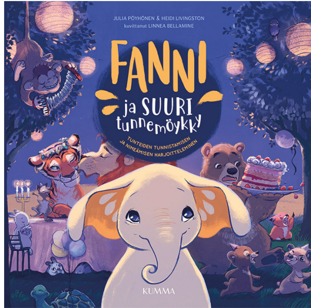
Kuva 2. & 3. Fanni-tunnetaitosarjan tuotantoa.

Jukka Hukka -sarja (2018–2019) on Avril McDonaldin kehittämä tunteita käsittelevä sarja. Jukka Hukka -sarjaan kuuluu tunnekortit sekä viisi kirjaa eri teemoineen. Tunnetaitoja harjoitellaan ja käsitellään kirjoissa lorumuotoisten tarinoiden muodossa. Lisäksi kirjoista löytyy käytännönvinkkejä tietyn asian tai teeman käsittelemiseksi. Sarja sopii 4–7-vuotiaille lapsille. (Tunnetaitoja lapselle 2020.)