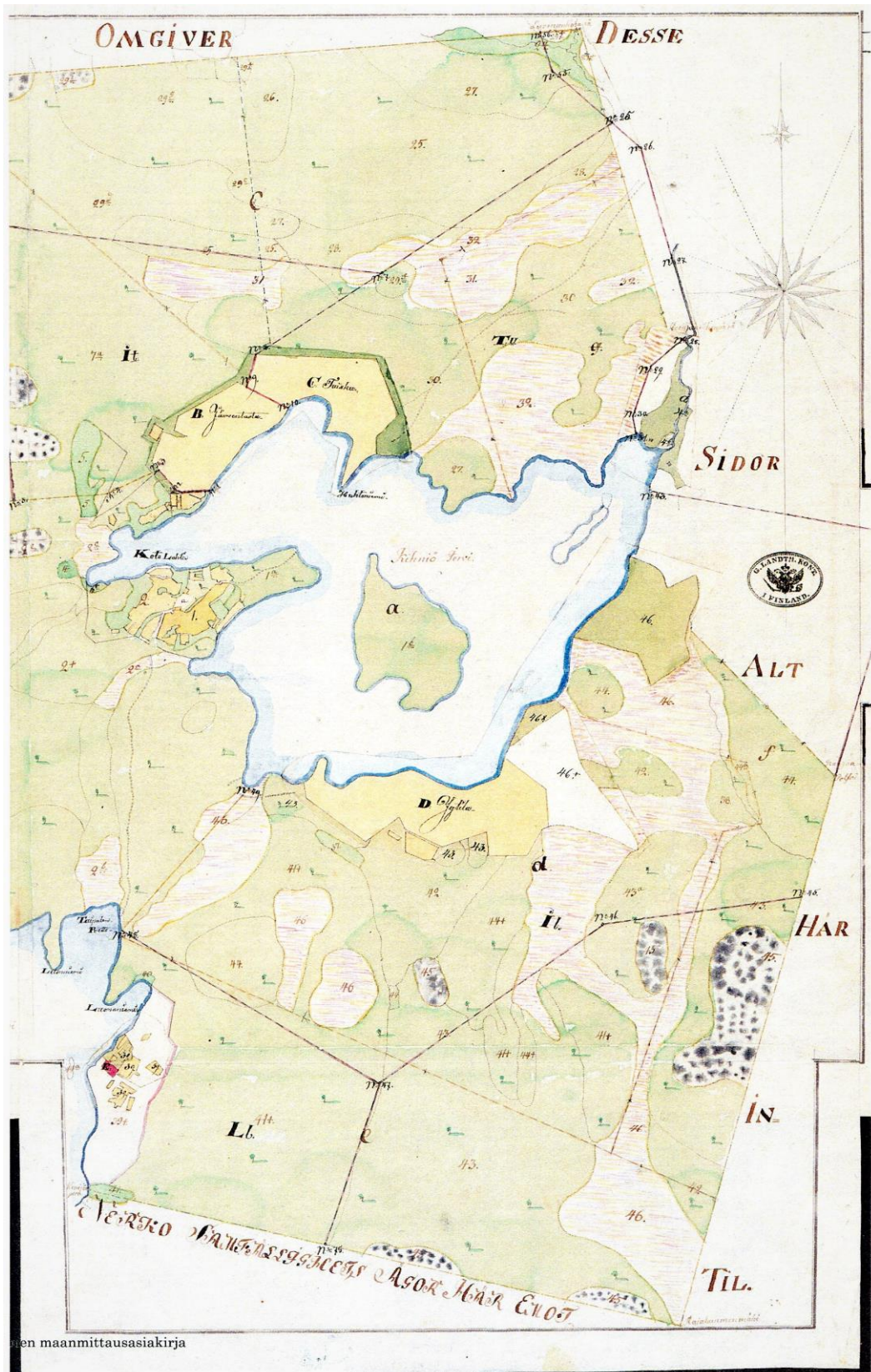
Kartta 3. Kihniön Korhosen talon ja neljän verojääkäritalon yhdistetty tiluskartta v. 1801, 1809 ja 1837 305