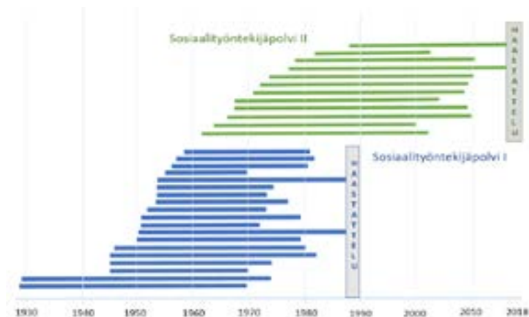
Kuvio 1. Sosiaalitoimistossa työskennelleiden haastateltujen työuran kesto sekä haastatteluaika 3

Jälkimmäiset 13 haastattelua, jotka tein Tampereen yliopiston Kokemuksen historian huippuyksikössä vuonna 2018, kartoitta- vat hyvinvointivaltion nopean laajentumisen ja vakiintumisen aikana, 1960–1980-luvuilla työnsä aloittaneiden työntekijöiden kokemuksia. Haastattelua ohjaava teemarunko nojasi edellisen polven haastattelujen malliin, mutta painottui muutoksen kokemuksen erittelyyn. Sosiaali- työntekijöiden ohella haastattelin myös sosiaalijohtajana ja vanhainkotien johtajina toimineita. Koska artikkelin painopiste on sosiaalitoimistossa tehtävässä sosiaalityössä, tutkimusasetelmaa havainnollistavan kuvion 1 sukupolviin on sisällytetty tiedot vain niistä haastatelluista, jotka työs- kentelivät osan urastaan sosiaalitoimistossa.