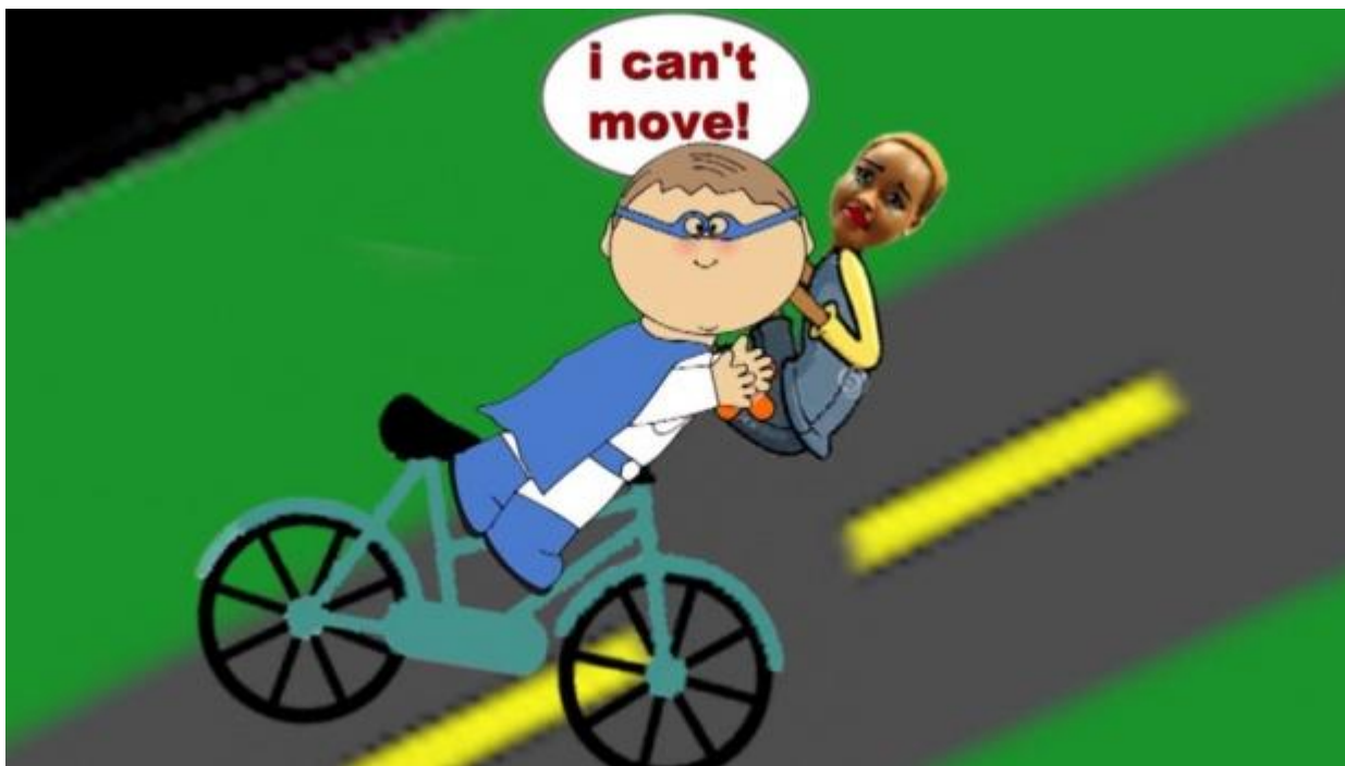
Kuva 5. Ruutukaappaus elokuvasta My Cycling Tale .