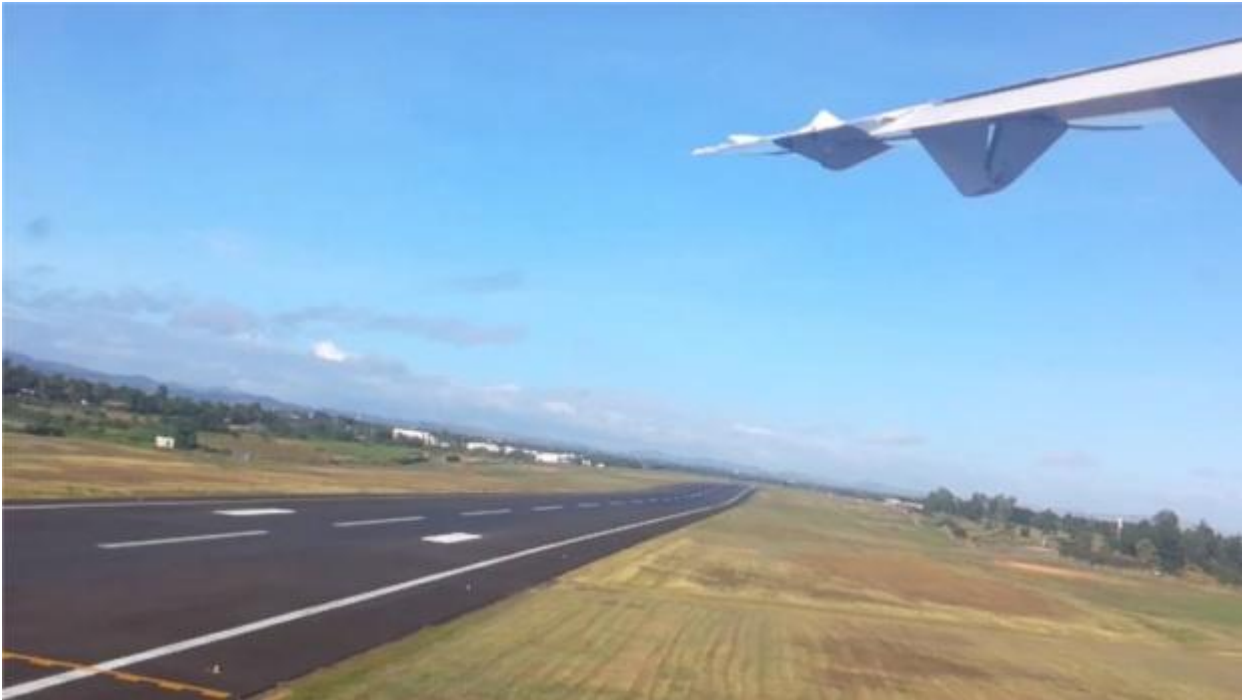
Kuva 6. Ruutukaappaus elokuvasta Forever Homesick .

Tina puhui paljon kielen kautta tapahtuvasta ulossulkemisesta. Vaikka elokuva keskittyy yleisemmin ulkopuolisuuden kokemuksiin, hän onnistui tuomaan mukaan myös alkuperäistä ajatustaan kielen vaihtamisen kautta tapahtuvasta ulossulkemisesta käyttämällä elokuvassa useita eri kieliä, joista osa on tekstityksenä. Keino synnyttää hämmennystä katsojassa, kuten tekijän mukaan oli tarkoituskin.