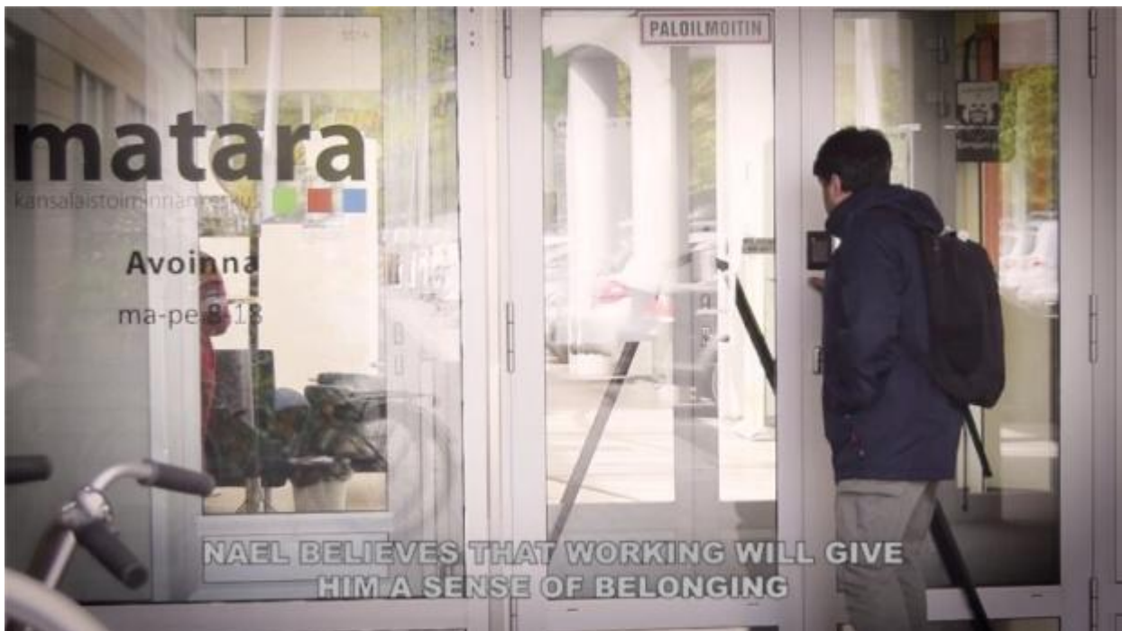
Kuva 7. Ruutukaappaus elokuvasta A Good Friend .