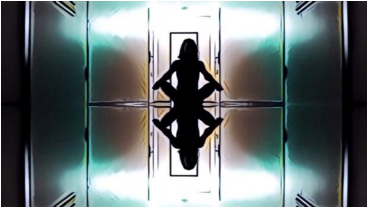
Kuva 8. Ruutukaappaus elokuvasta Six Breaths to Belong .