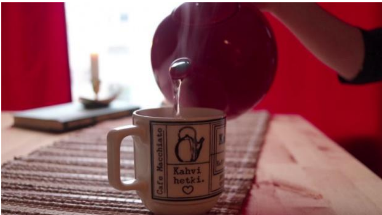
Kuva 4. Ruutukaappaus elokuvasta Smells of Belonging .