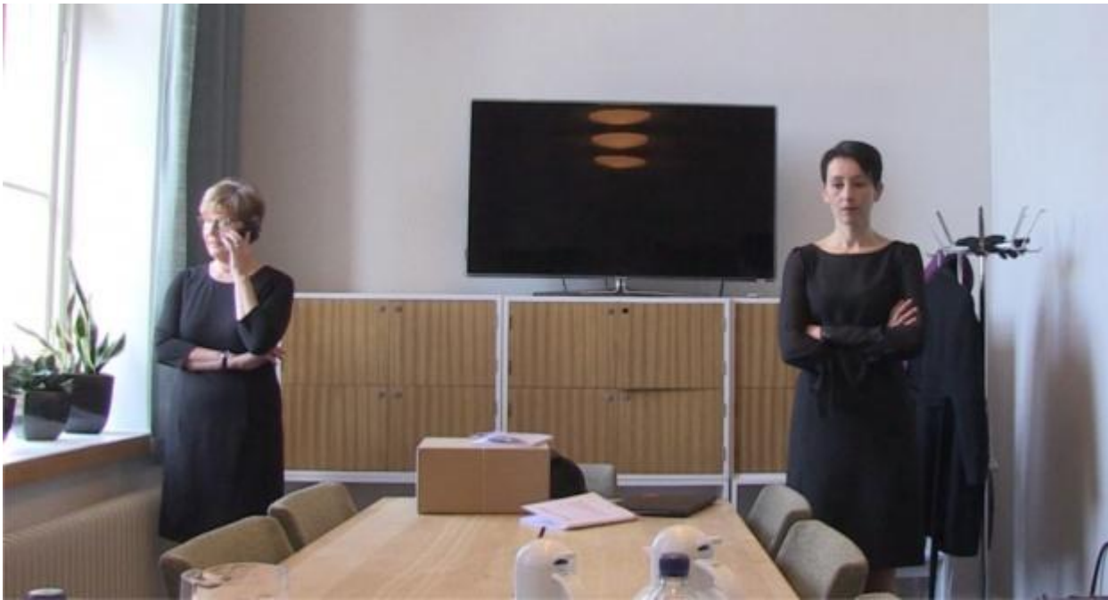
Kuva 2. Ruutukaappaus elokuvasta Väitös .