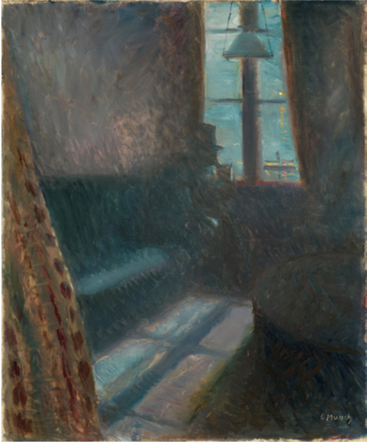
Kuva 4. Edvard Munch, Yö Saint-Cloudissa , 1890.

lija koki, että heidän välilleen jäi selvittämättömiä asioita, kuten ristiriidat isän porvarillisen ja uskonnollisen maailmankatsomuksen ja Edvardin vertaisikseen kokemien Kristiania-boheemien arvomaailman välillä. Pohjimmiltaan isäänsä vastaan kapinoiva Edvard oli syvästi uskonnollinen, mutta pyrki kuitenkin ajoittain mel-