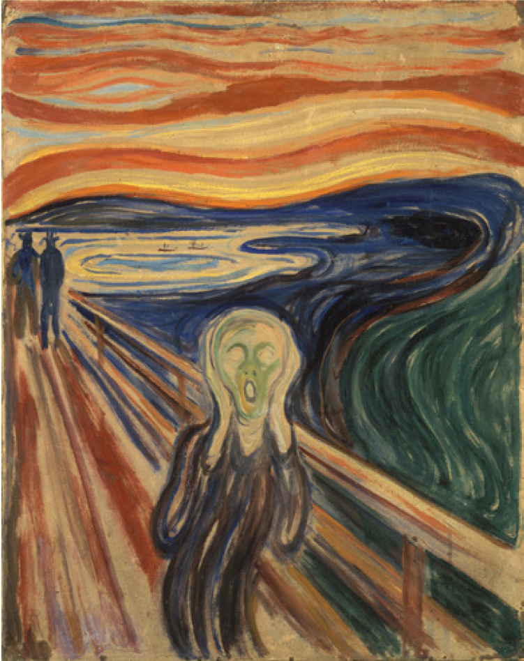
Kuva 5. Edvard Munch, Huuto , 1910?

Keskeisin ero on, että myöhäisemmässä maalauksessa sillalla seisovalla ihmishahmolla ei ole pupilleja, mikä aikaansaa voimakkaamman vaikutelman sisäisestä kokemuksesta. Varhaisemmassa teoksessa hahmo näyttää ikään kuin katsovan sillalla edessään ole-