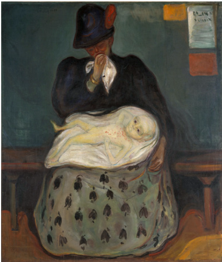
Kuva 6. Edvard Munch, Perinnöllisyys , 1897.

1800- ja 1900 -lukujen vaihteessa Munch matkusti paljon ja oleili pitkiä aikoja etenkin Ranskassa ja Saksassa. Vuosina 1896–97 hän vieraili taiteilijana pariisilaisissa sairaaloissa ja mielisairaaloissa ja tutustui niiden lääkäreihin ja psykiatreihin. Munch on myös kuvan-