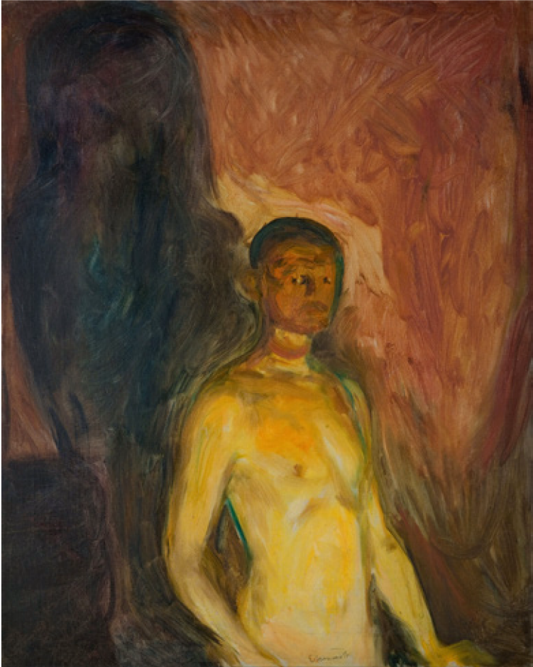
Kuva 7. Edvard Munch, Omakeuva helvetissä , 1903.