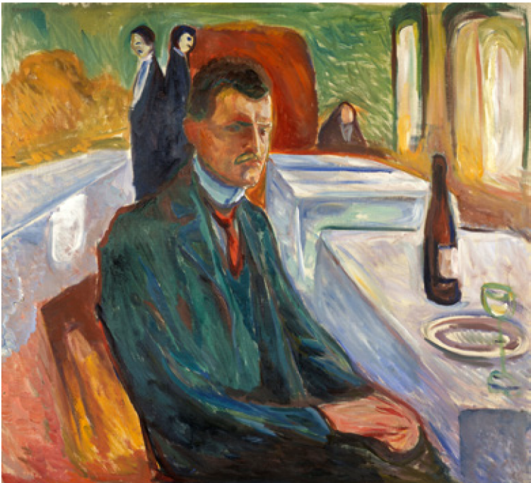
Kuva 2. Edvard Munch, Omakeuva viinipullon kanssa , 1906.