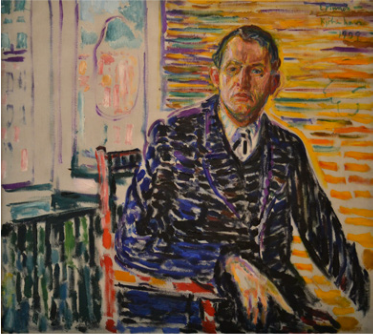
Kuva 8. Edvard Munch, Omakuva klinikalla , 1909.