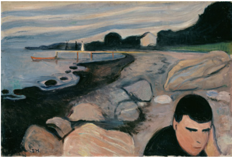
Kuva 3. Edvard Munch, Melankolia , 1892.

Neuroottisuuteen taipuvainen Munch kärsi ajoittain avaran paikan kammosta ja korkean paikan kammosta, mikä ilmeni esimerkiksi huimauksena ja haluna kulkea silmät suljettuina ahdistaviksi koetuissa paikoissa. Koska esimerkiksi vuoristomaisema ahdisti Munchia, hän etsiytyi kesänviettoon merenrantamaisemiin. Lisäksi taiteilija kärsi ajoittain aistien, erityisesti näkö-, kuulo- ja tuntoaistin ylivityydestä. Kausiluontoinen alkoholin suurkulutus todennäköisesti ruokki tätä ongelmaa. Hankalat elämäkokemukset, runsas päihteiden käyttö ja ”juoppohulluuskohtaukset” ajoivat Mun-