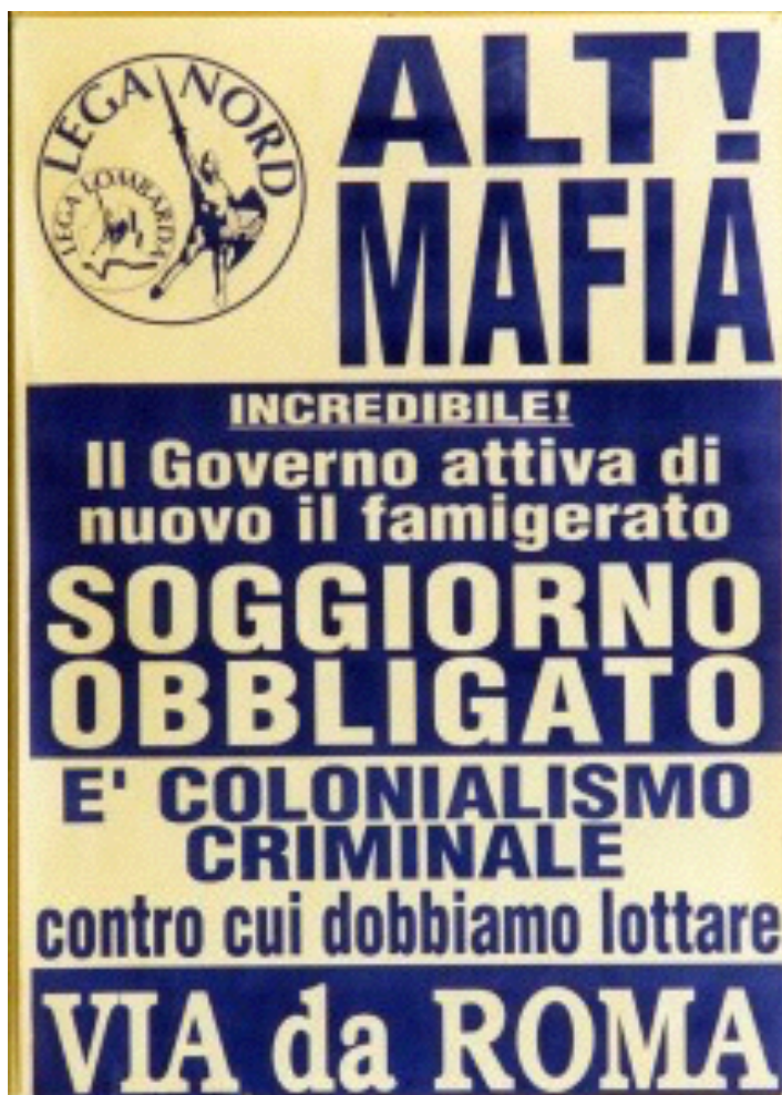
Kuvio 12. Lega Nordin vaalijuliste 1992.

Viimeiseksi tarkastelen pohjoisen federalistien käyttämää poliittista kuvastoa. Sen osalta käsittelen Lega Nordin vuoden 1992 parlamenttivaaleissa käyttämää julistetta (kuvio 7). Se vaikuttaa pintapuolisesti katsoen hyvin yksinkertaiselta, mutta monista seikoista voi päätellä, että kyseessä on itse asiassa tarkasti valittu tehokeino.