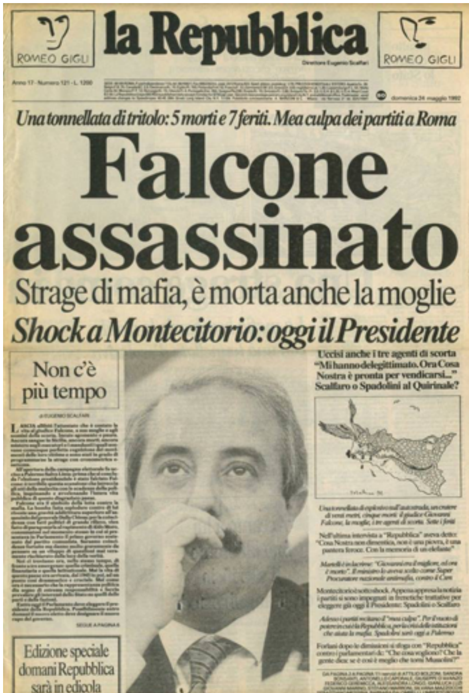
Kuvio 8. La Repubblica etusivu 24. toukokuuta 1992.

Bettino Craxi 259 , alaston Giovanni Spadolini 260 tai pätjänä esitetty Berlusconi. Pitkän uransa aikana Forattini on piirtänyt suurista päivälehdistä La Stampalle ja La Repubblicaalle , joskin hän on myös ajautunut välistä erimielisyyksiin edustamiensa lehtien toimituksellisen linjan kanssa.