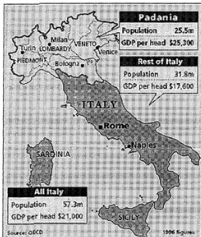
Kuvio 5. Italian alueellinen epätasapaino BKT:ssa henkeä kohden 1996. 68

Sinänsä alueelliset eroavaisuudet, sikäli kun niillä viitataan paikallisyhteisöihin, -kulttuureihin ja -murteisiin, mahtuvat ”suureen italialaiseen kertomukseen”: tässä katsantokannassa lukuisat keskiaikaiset kaupunkivaltiot, joissa syntyi ”uusi yhteisö, joka perustui kapitalistis-merkantilistiselle taloudelle, uudelle poliittiselle järjestelmälle ja uudelle kulttuurille”, olivat erillisiä toisistaan, mutta niitä yhdisti tietty ” idea dell’Italia ”. 69 Sen sijaan perustavanlaatuisen pohjoinen–etelä-jakolinjan näkeminen Italian sisällä on paljon suurempi haaste yhtenäisen kansallisvaltion idealle. Lisäksi jo pelkkä kaupunkivaltioiden näkeminen keskeisenä osana Italian kansallisia myyttejä on tässä yhteydessä vaarallinen, sillä suuret kauppakaupungit sijoittuivat pääosin pohjoiseen. ”Padanian” itsehallintoa ajava oikeistopopulistinen Lega Nord -puolue on jopa puhunut ”maantieteellisestä petoksesta”, jossa ”Italiasta” puhutaan niemimaana: sen näkemyksen mukaan Pohjois-Italia ei oikeastaan kuulu lainkaan maantieteelliseen Apenniinien niemimaahan vaan keskiseen Eurooppaan. 70