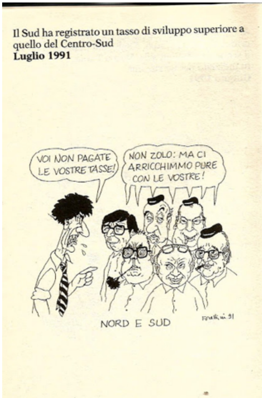
Kuvio 11. Forattinin pilapiirros heinäkuulta 1991.

Forattinin heinäkuussa 1991 julkaistu pilapiirros on ilmestynyt ajallisesti hyvin lähellä Lega Nordin kesäkuista puolueohjelman lanseerausta ja perustavanlaatuisen reformien vaatimista. Kuva on otsikoitu nimellä Nord e Sud , etelä ja pohjoinen. Yläkulmaan lisätyn selityksensä mukaan se liittyy etelän ilmoittamiin hyviin talouskasvulukuihin. Tätä voisi äkkiseltään ajatella positiivisena