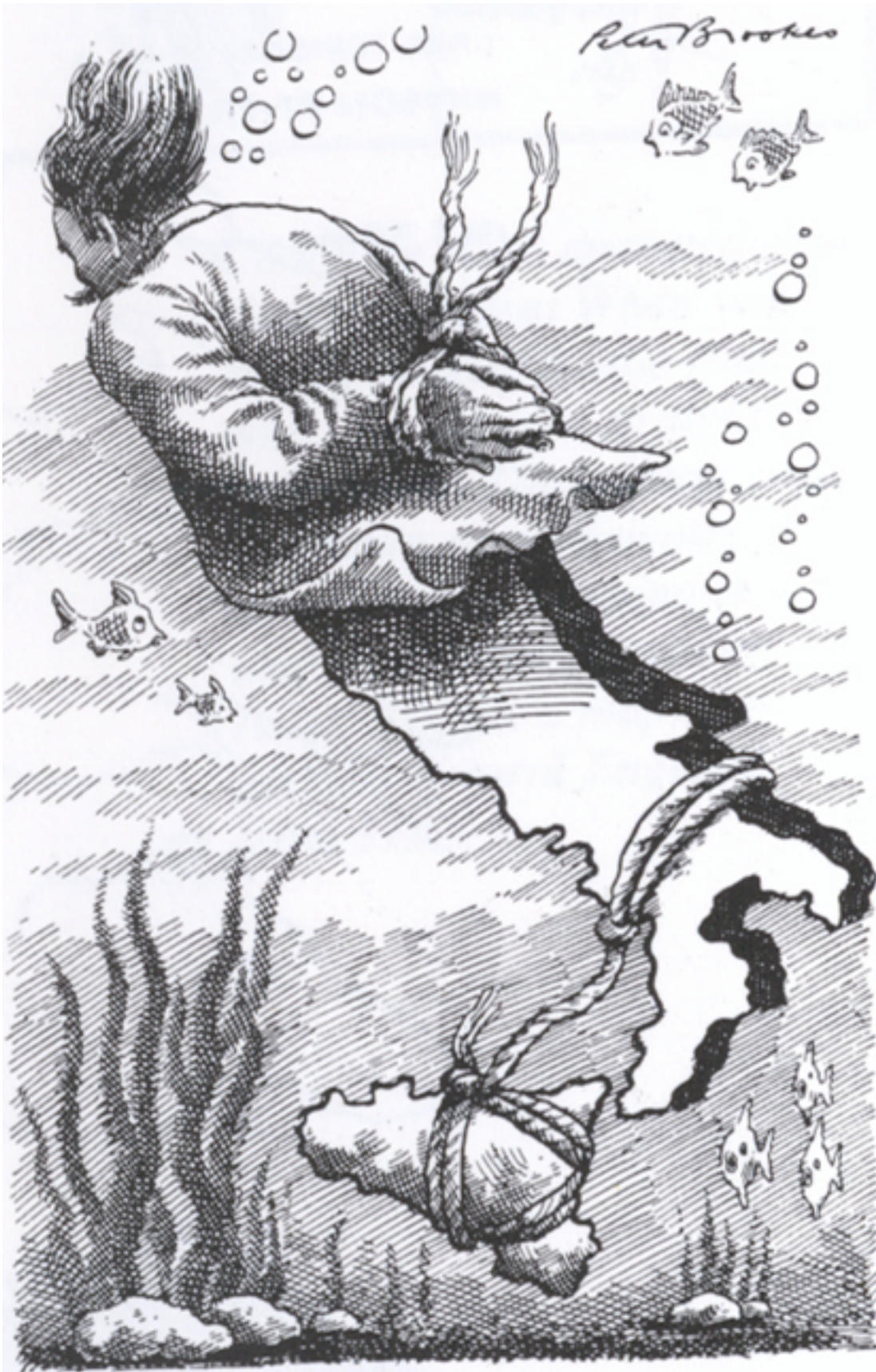
Kuvio 1. Peter Brookesin pilapiirros The Times -lehdessä 1986