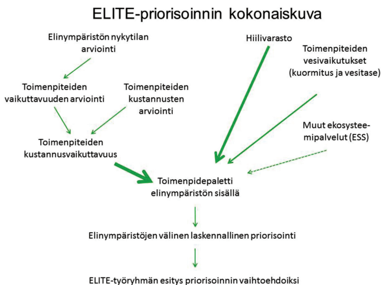
Kuva 3. ELITE-menetelmällä toteutettavan priorisoinnin vaiheet.

Toimenpiteiden hyödyt ja kustannukset käyttäytyvät ajassa eri tavalla. Tosiasiassa elinympäristöjen tila edistyy edistävistä toimenpiteistä huolimatta omaa tahtiaan hitaasti luontaisen sukkession kautta. Ekosysteemien kehityssuuntaa voidaan toimenpiteillä muuttaa, mutta kehitys kestää kohteesta ja toimenpiteestä riippuen usein pitkänkin ajan. Tässä työssä lähtökohdaksi otetaan kuitenkin se, että hyötyjen ajatellaan realisoituvan täysimääräisesti heti kun toimenpide on suoritettu, eikä arvioida, millä aikataululla hyödyt toimenpiteen jälkeen todellisuudessa realisoituvat. Elinympäristöjen tilan edistymisen aikataulun arvioiminen vaatisi erittäin paljon työtä.