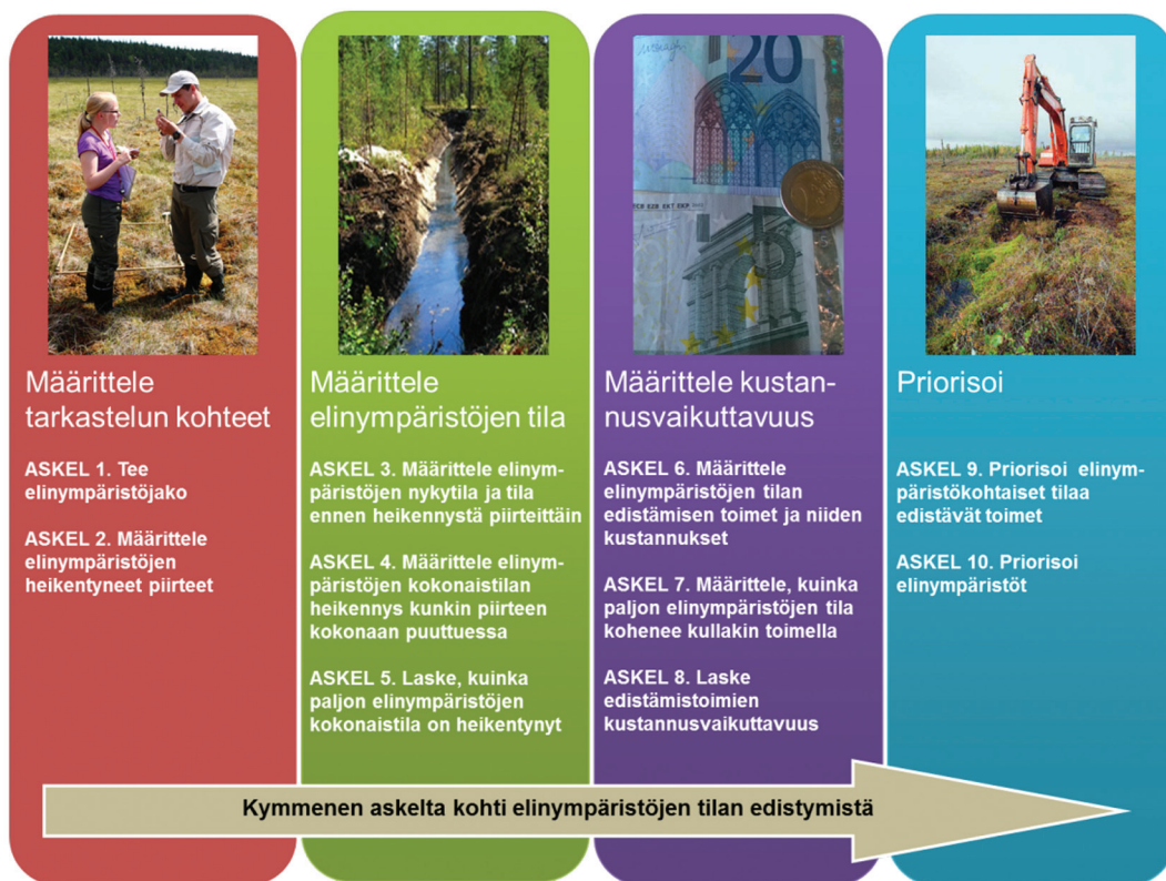
Kuva 4. ELITE-menetelmän kymmenen askelta.