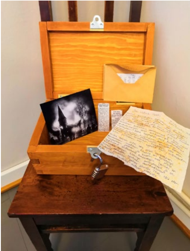
Ensimmäisen lukon takaa löytyy käsinkirjoitetun kirjeen alkuosa, kuva palavasta Taulumäen kirkosta, seuraavan lukon avaamiseen johtava revitty kuva sekä kaksi hämähäiseksi tarkoitettua lehtiartikkelia.

voa kohtaan asetettuja syytteitä. Toisen lukon avaamiseksi suorittajien tulee huomata revityn kuvan taakse kirjoitettu teksti, jossa ohjataan heitä lukemaan Suomen historiallisen seuran pöytäkirjojen artiklat sivuilta 32-33.