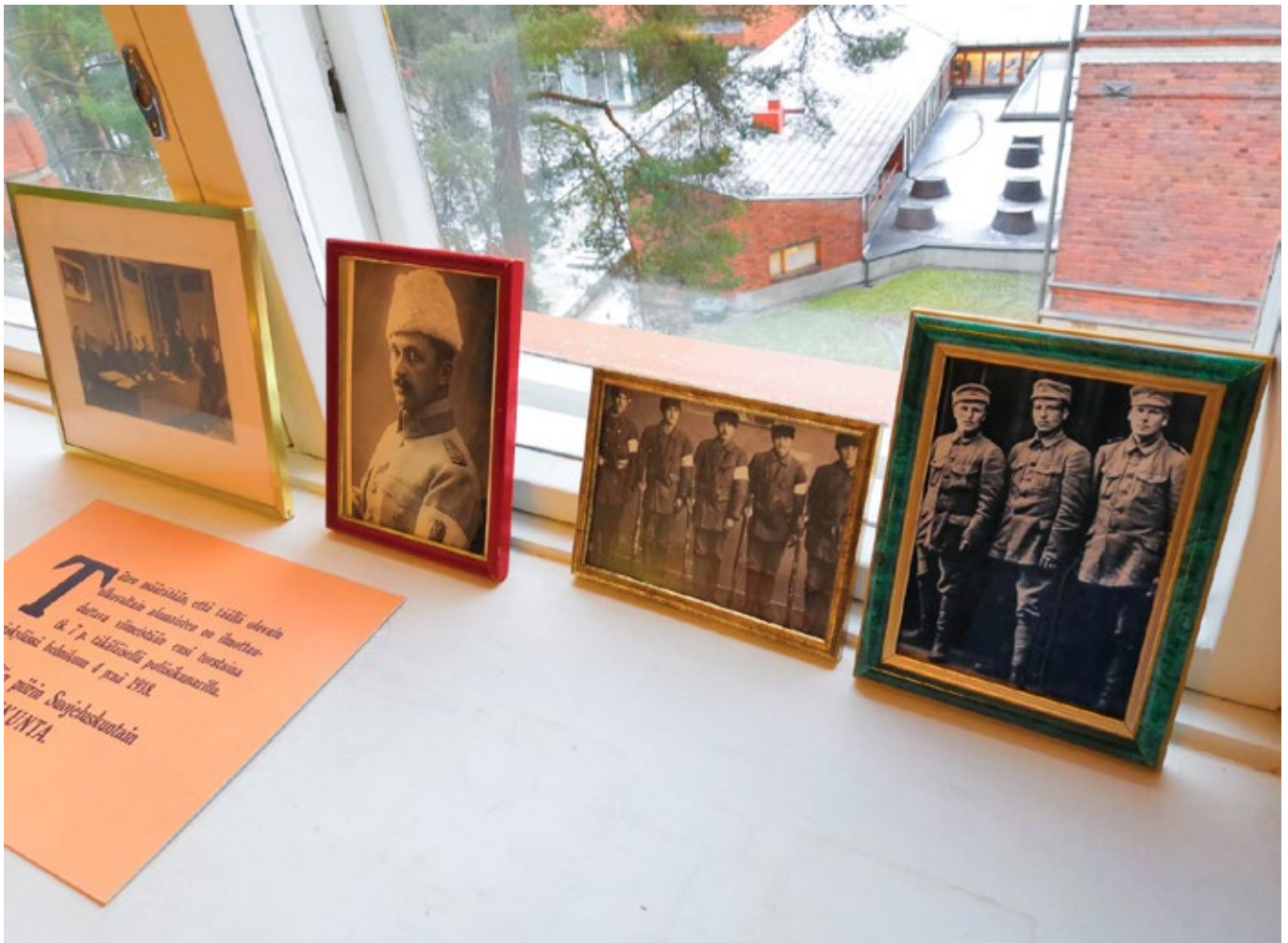
Ensimmäisen lukon avaamisessa auttava vihje tulee löytyä niistä aineistoista, jotka huoneessa ovat vapaasti saatavilla suorittajien sinne saapuessa.