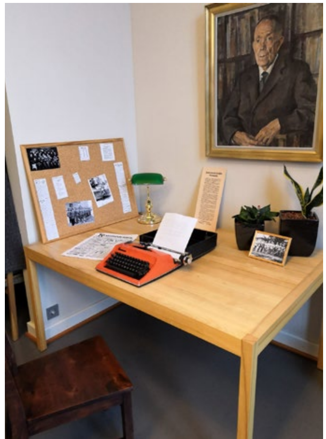
Huoneessa sijaitsevalta työpöydältä löytyy rekvisiittaa, huoneen ratkaisemisen kannalta merkityksellistä materiaalia sekä hämäysmateriaalia.