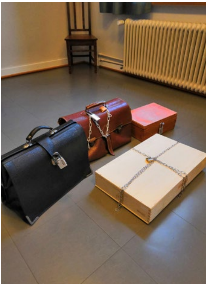
Vihjeet voidaan piilottaa erinäisiin salkkuihin tai laatikoihin, jotka pystytään sulkemaan lukolla.

Kyiseissä huoneessa eniten ongelmia tuotti kahden ensimmäisen numerolukon avaaminen. Kuvien aikajärjestyksen ja henkilömäärien välisen yhteyden löytäminen ja sen avulla lukon avaaminen oli useilla ryhmillä vasta pitkän ajatustyön, suorittajaryhmän yhteistyön sekä parin annetun vihjeen takana. Myös se, että kuvat piti asettaa aikajärjestykseen, ei ollut kovin helppoa suorittajille. Toisessa lukossa suurimman ongelman tuotti se, etteivät suorittajat osanneet tarkastella kirjan sisällysluetteloa tarvittavalla tavalla, jolloin heiltä jäi tajuamatta se, että kirjasta löytyy useampi samat sivunumerot sisältävä aukeama. Pientä vaikeutta tuotti myös fraktuuralla kirjoitetun Keskisuomalaisen Taulumäen kirkon paloa koskevan uutisen sekä Sosialisti-lehden kirjoituksen tulkitseminen, mutta Sosialisti-lehden kirjoituksen kohdalla valmiiksi alleviivatut kohdat auttoivat tämän kohdan ratkaisemisessa juuri sopivasti.