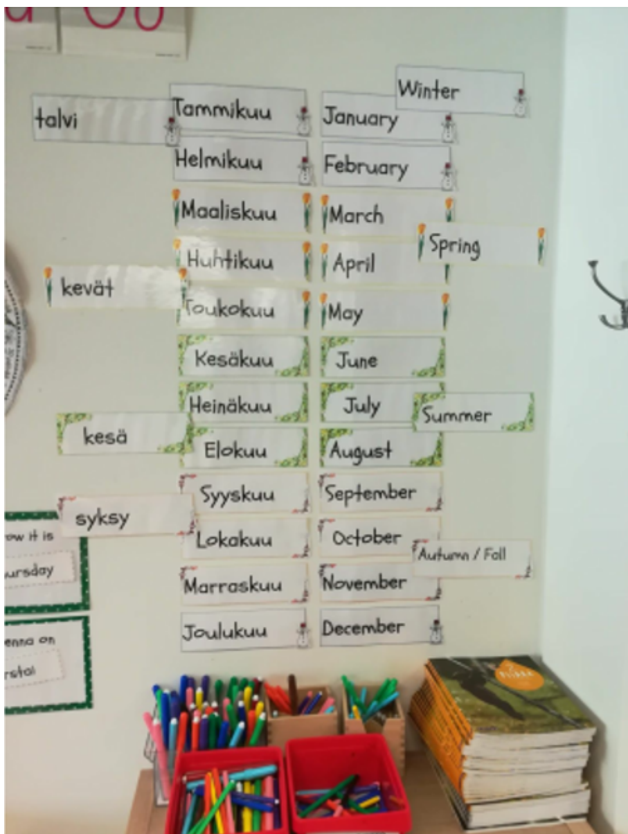
Kuva 2.

Yksinkertainen kalenteri esittää toisaalta kuukaudet kahdella kielellä, toisaalta sen, miten osa kuukausista saattaa kuulua eri vuodenaikaan eri puolella maailmaa.