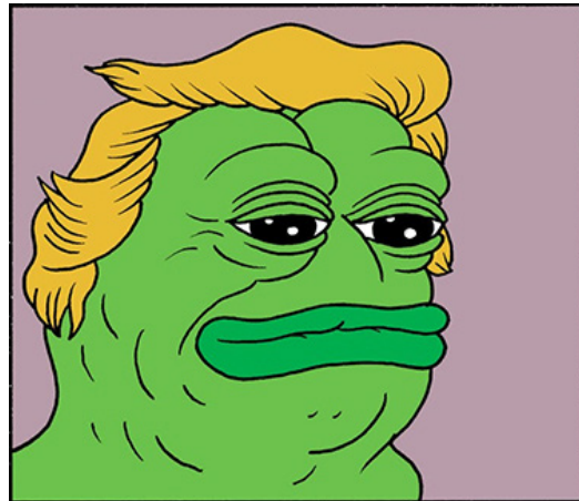
Kuva 5. Pepe muuntautumassa Donald Trumpiksi (Furie 2016).

töön julkaisten ensin sarjakuvan, jossa Pepe muuntautuu Donald Trumpiksi apokalyptisessa painajaisessa (ks. Kuva 5), ja saattaen sitten Pepen haudan lepoon toisessa sarjakuvassa. Hän on myös yrittänyt käyttää tekijänoikeuttaan rajoittaakseen äärioikeiston Pepen käyttöä (Gault 2018).