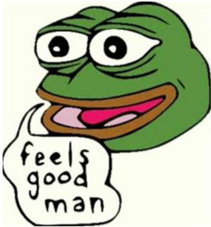
Kuva 4. Matt Furien piirtämä alkuperäinen Pepe (2006).