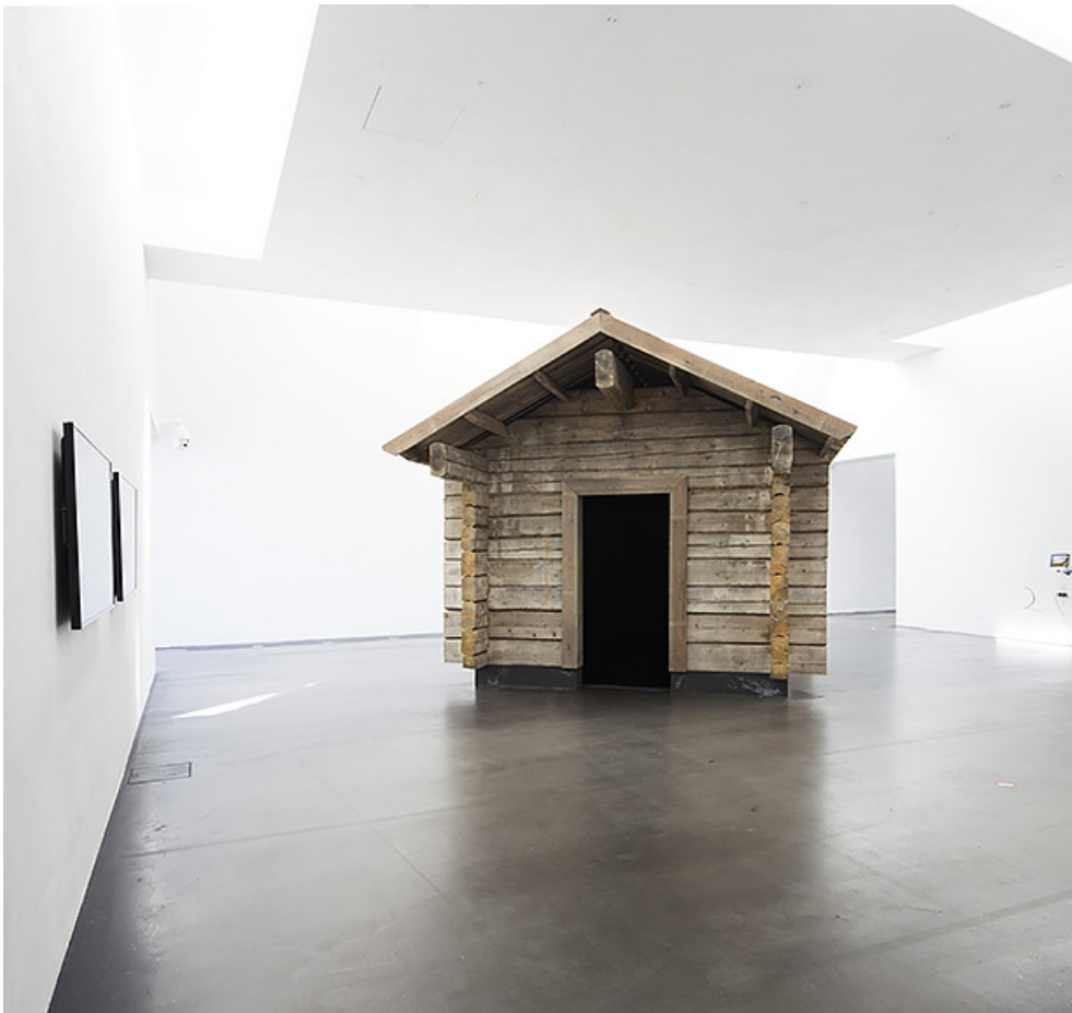
Kuva 1. Hirsimökki Kiasman galleriatilassa.

oli katseltavissa hirsimökissä koko lopun ARS17-näyttelyn ajan, tammikuulle 2018 saakka.