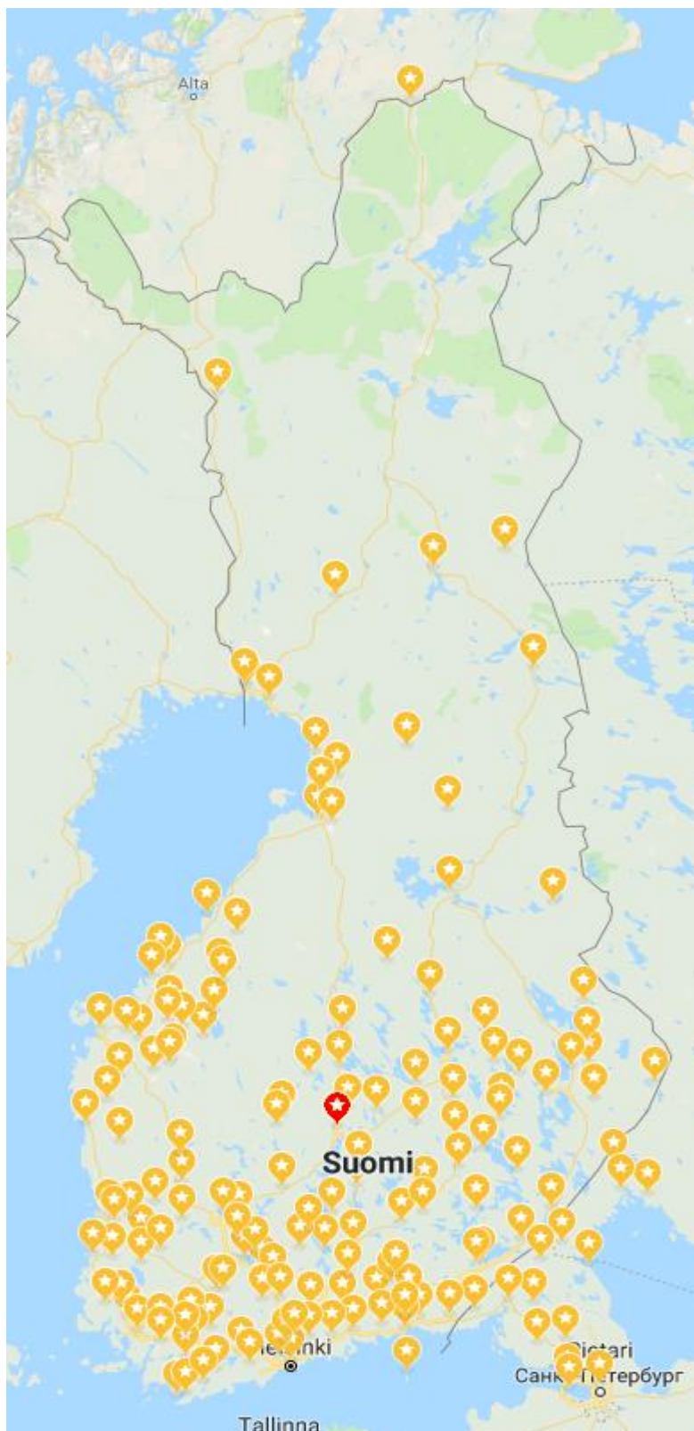
Kartta 1. Leinbergille kirjeitä lähettäneiden henkilöiden paikkakunnat kartalla. Jyväskylän kansakouluseminaari merkitty karttaan punaisella. Karttapohjana Google Maps.