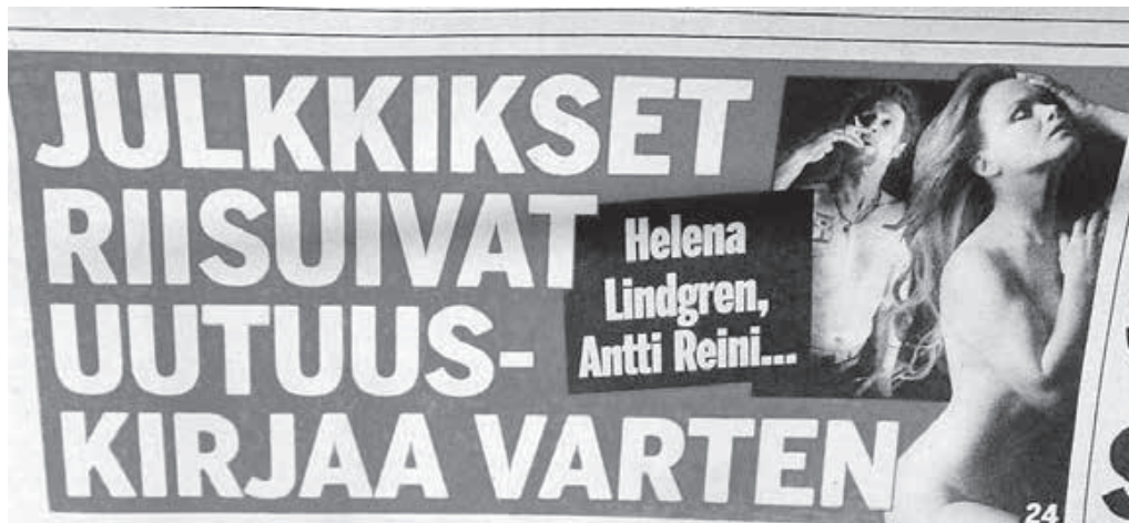
Kuva 1. Seksuaalisuuteen yhdistetty ”avautuminen” ja ”itsensä paljastaminen” ovat yksi kirjojen myyntikeino nykyisessä markkinakapitalismissa.