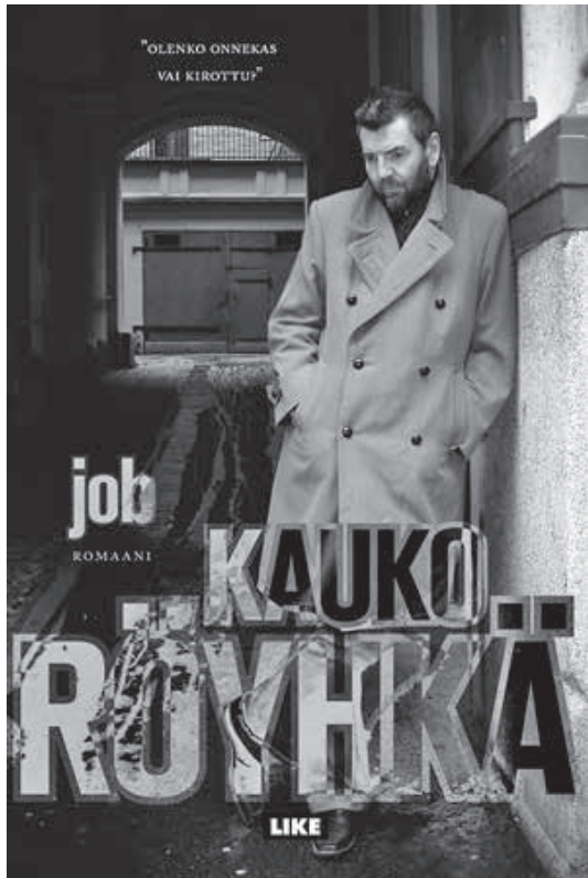
Kuva 2. Markkinoituneessa kirjallisessa kulttuurissa myydään näkyvämmiin kirjailijabrändejä kuin kirjallisuutta. Kauko Röyhkän Job -romaanin (2008) kansikuva.

Olen jo kyllästymiseen asti korostanut sitä, että ammattini harjoittaminen ei ole minulle niinkään taiteellista itseilmaisua kuin työtä, jonka ansioilla selvitään sosiaalisista lähivelvoitteista. Yleisimmin ja ylevämmin ilmaistuna kyse on oikeudesta seisoa yhteiskunnan jäsenenä muiden ihmisten joukossa. (KE, 230.)