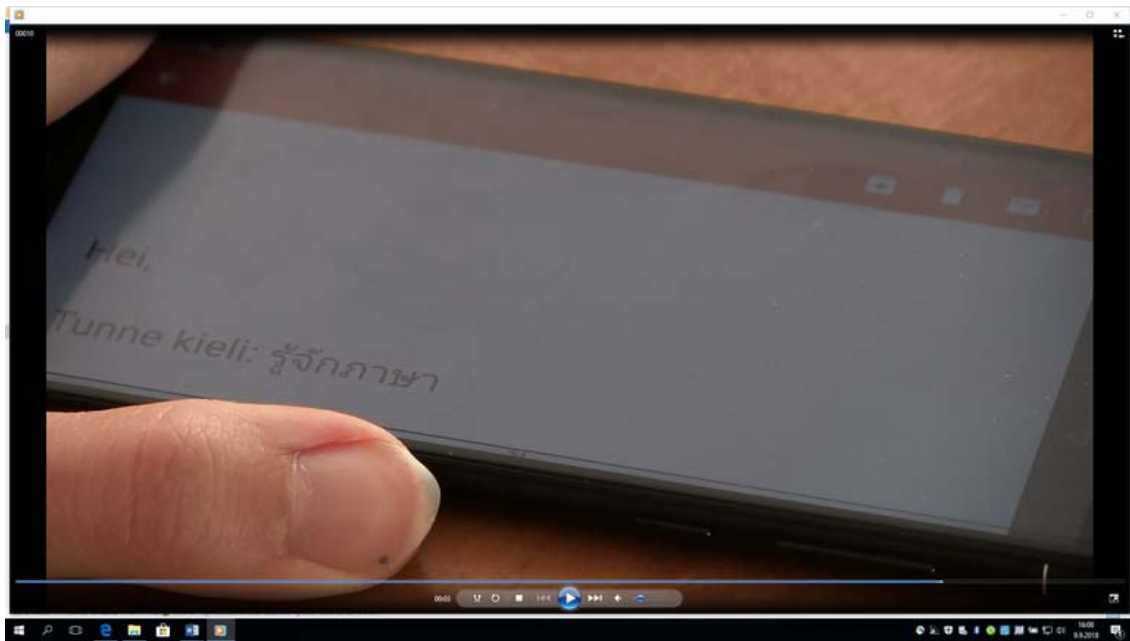
Kuva 1: Sähköinen media luo siltoja kieliin ja kieleilyyn välimatkoista piittaamatta.

Keinoja erilaisiin kielentämisen tapoihin ja kulttuureihin tutustumiseen tarjoaa ennen kaikkea lähiympäristön kielellinen variaatio. Omassa opetusryhmässä hyvä alku eri kielten huomioimiseen on oppilaiden erilaisten kielimaisemien näkyväksi tekeminen. Ensimmäinen askel voi olla esimerkiksi oppilaiden (yhtä hyvin aikuisten tai päiväkotiryhmän lasten) arjen vuorovaikutustilanteiden visualisointi siltä kannalta, miten kielet ja kielimuodot vaihtelevat ja limittyvät kullakin oppilaalla päivän aikana (ks. myös Maledive-hankkeen kotisivuille kootut vinkit ja materiaalit). Seuraava askel voi olla vaikkapa oppilaiden tekstimaailmoista löytyvien erikielisten puhuttujen, kirjoitettujen ja multimodaalisten tekstien kerääminen ja tutkiskelu yhdessä (esim. kaveri- tai harrastusporukan, Skype-mummin, vaatteiden, eväspussukoiden, pulpettikirjan, YouTube-kanavan, verkkopeliyhteisön jne. tekstit). Kielitietoisien koulun tulisi myös tarjota kaikille oppilaille kurkistusikkunoita maailman kielelliseen diversiteettiin oman lähiympäristön ulkopuolella.