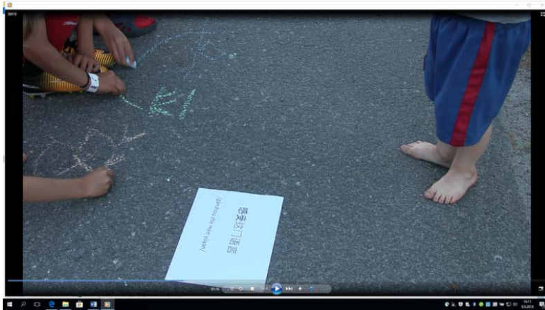
Kuva 2: Lapset innostuivat kokeilemaan mandariinikiinan kirjoittamista 感受这门语言 ja ääntämistä /gǎnshòu zhè mén yǔyán/ ('tunne kieli!').